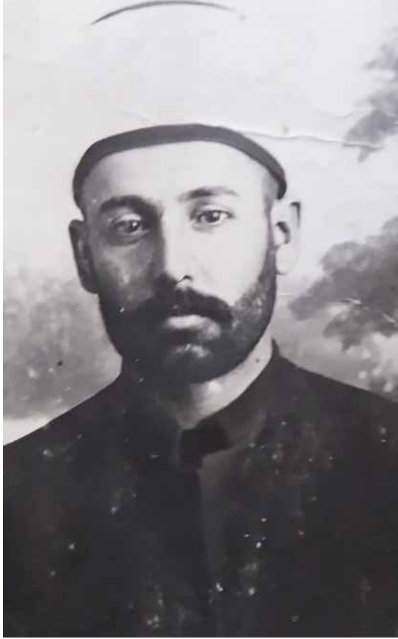
Hafız Hoca Ahmet Efendi

1920'li yıllarda patlak veren Konya Delibaşı Mehmet İsyanı sırasında, kendisine nefer bulmaya çalışan isyanın elebaşı Delibaşı Mehmet, İsmil'den kendisine destekçi bulamamış ve buna çok sinirlenmiştir. Yanlışlarını yanına alarak İsmil'e baskına gitmeye karar vermiştir. Bir öğle vakti İsmil'e atlıları ile gelen Delibaşı Mehmet'i Hafız Hoca Ahmet Efendi köy meydanında karşılaşmış ve kendisini mescide davet ederek uzun bir görüşme gerçekleştirmiştir. İsmil'e zarar vermek niyeti ile gelen Delibaşı Mehmet'i uygun bir dille ikna ederek İsmil'den uzaklaştırmıştır. Böylece İsmil'in bu isyana bulaşmasını önlemiştir.