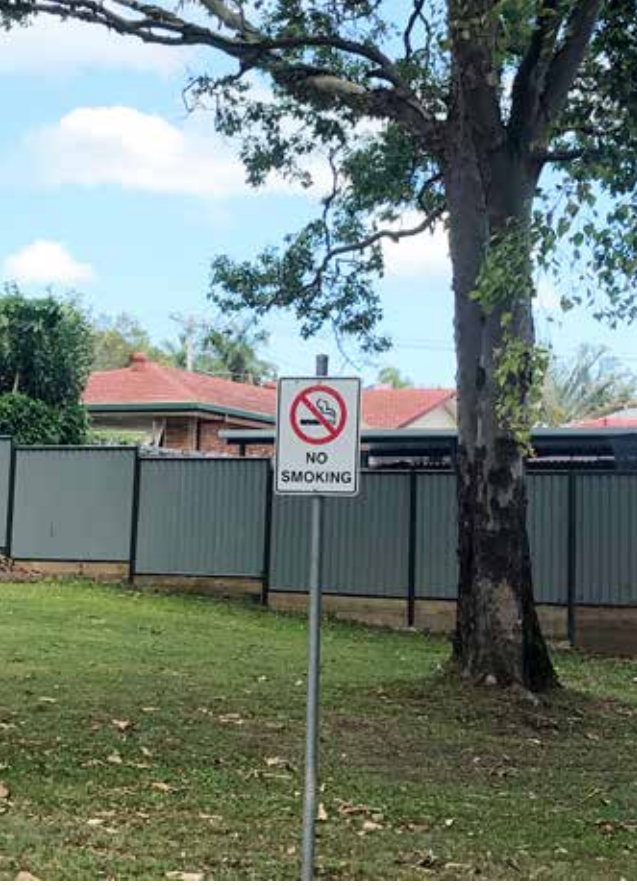
Parkta sigara içilmez uyarısı

meye de başlıyor. Tabii ilk önce on'a kadar saymayı. Başka zamanlarda dili hemen İngilizceye kaysa da saklambaç oynarken ebe olduğunda saymayı hep Türkçe yapıyor.