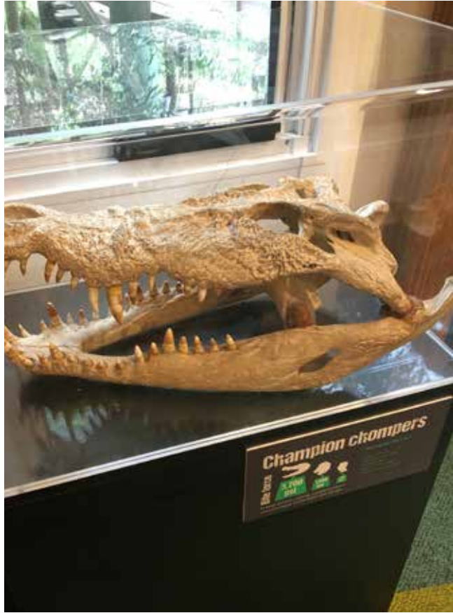
Merkez'de sergilenen timsah kafatası