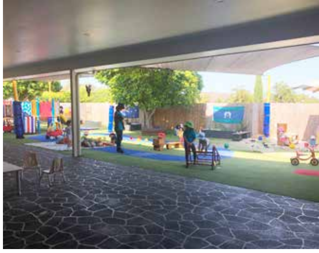
Sınıfın önündeki oyun bahçesi

Seffane parkta babaannesini bayağı yoruyor. Artık sıkılmış olmalı ki bir ara parkın ortasını boydan boya kesen beton yürüyüş yolundan evimizin aksi istikametine yöneliyor. Babaannesinin dur, ikazlarını duymuyor. Bunun üzerine babaannesini de