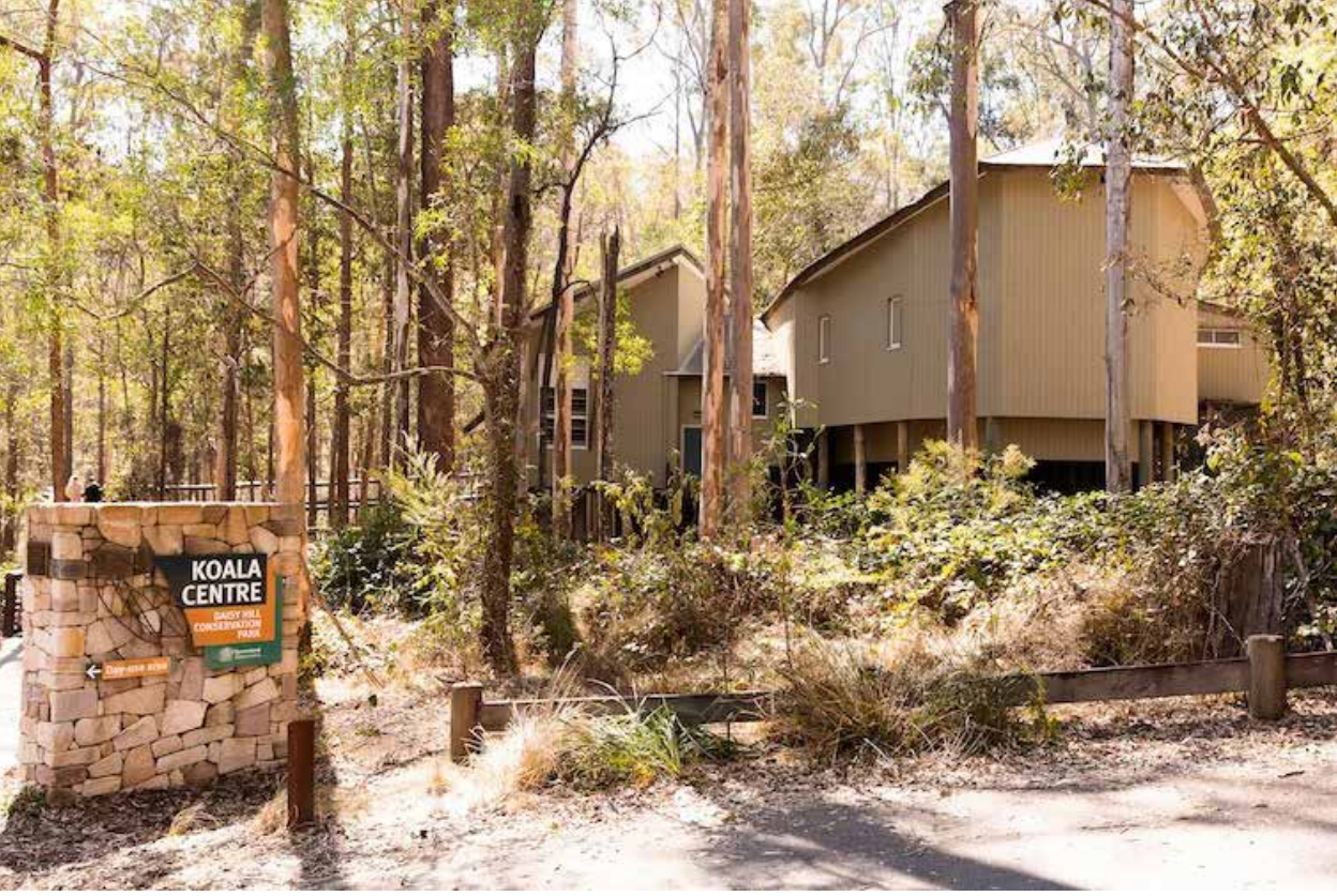
Daisy Hill Koala Merkezi