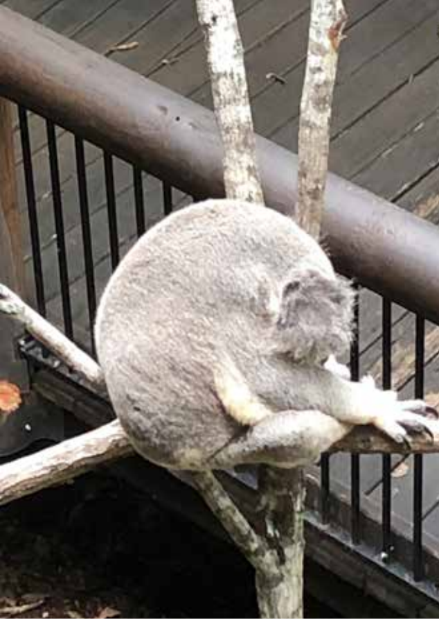
Merkez'de yaşayan bazı koalalar