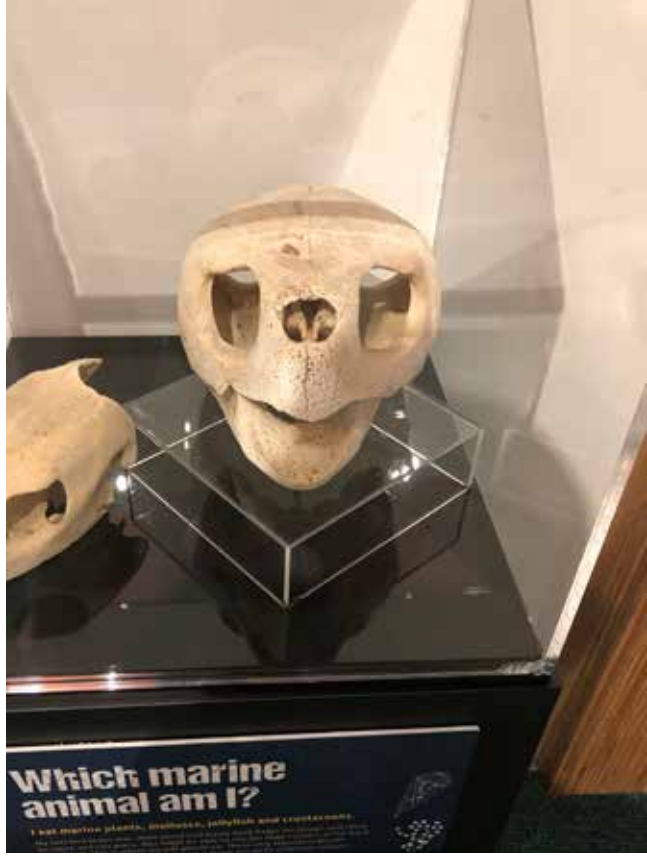
Merkez'de sergilenen deniz kaplumbağası kafatası

Tesis fazla büyük olmadığı, bizde de dil olmadığı için burayı gezmemiz uzun sürmüyor. Merkezden ayrılırken ilimiz sınırları içerisindeki Bozdağ'da yaşayan Anadolu yaban koyunları için böyle bir merkezin düşünülmemesine hayıflanmaktan kendimi alamıyorum. (Devam edecek)