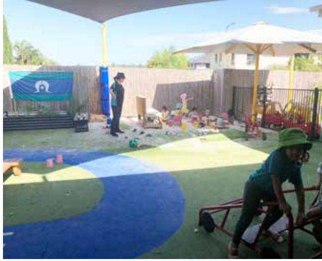
Oyun bahçesi ve kum havuzu