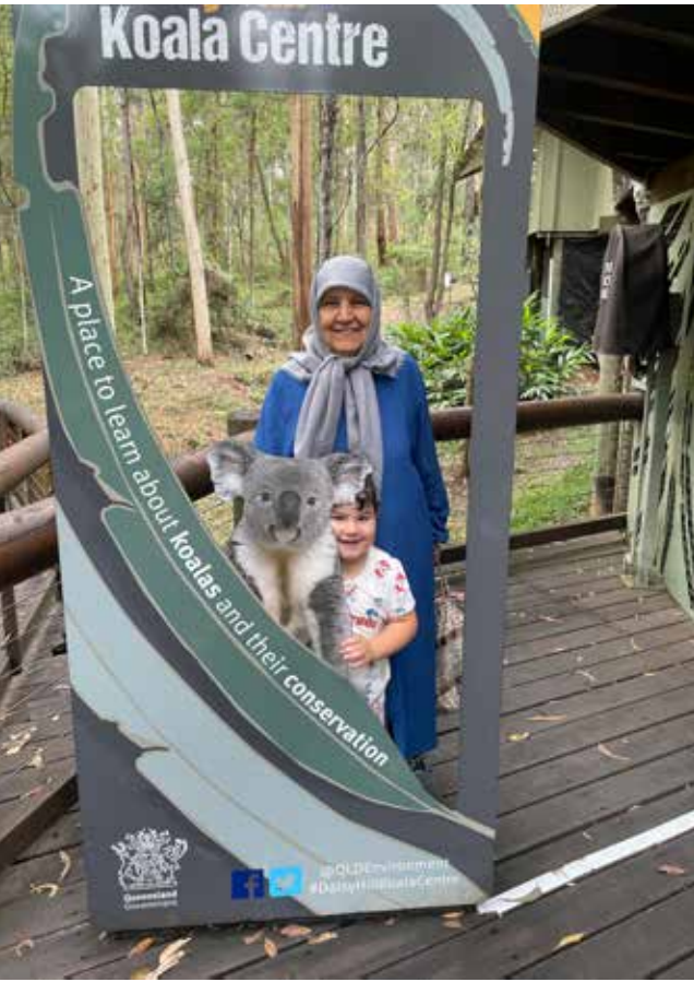
Daisy Hill Koala Merkezi girişi