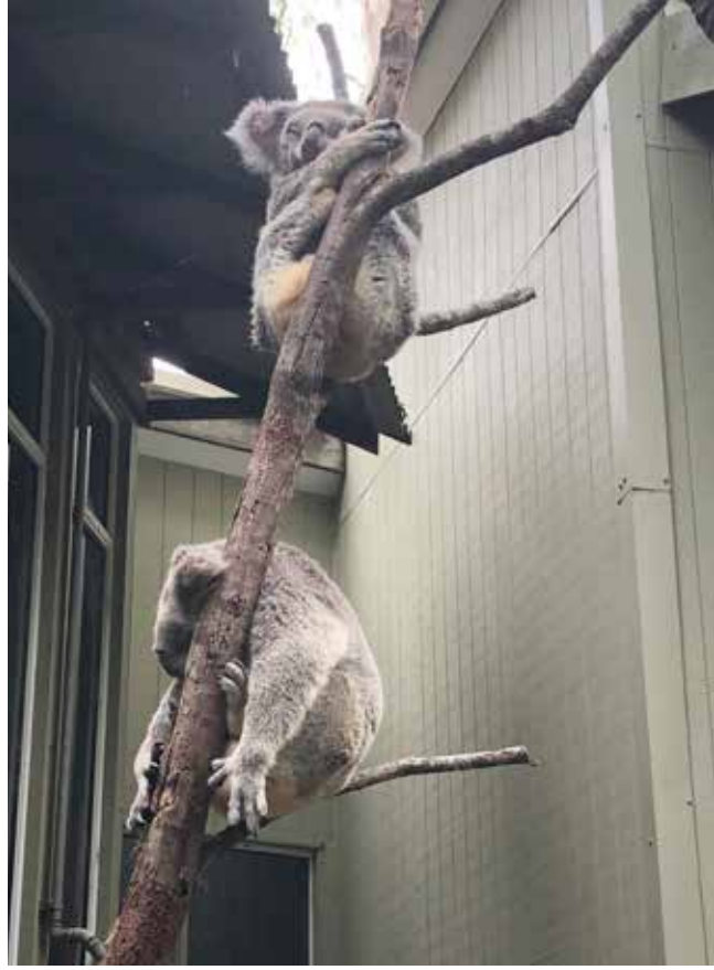
Merkez'de yaşayan bazı koalalar

Koala kelimesinin kökeni, Darugcada "su yok" anlamına gelen kulavan ya da gulavan ya-