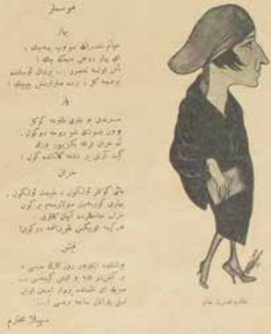
Halide Nusret Zorlutuna'nın karikatürü, Süs

İşte o şimdi devler elinden kurtulmuş zindandan çıkmıştır. Onun şerefine bütün mahpuslar da çıkmışlardır. Herkesin kendine göre bir hürriyet anlayışı vardır ve onunki de budur. Asıl mühim olan da babasının geliyor olmasıdır. Küçük Halide 7 yaşındadır ve ilk defa görecektir babasını. Bir küçük madalyon içinde annesinin boynunda taşıdığı resimden biliyordur babasını... Babası çok yakışıklı bir genç adamdır; uzun bıyıkları, tatlı güzel gözleri vardır. İşte ona kavuşacaktır. Ömründe böyle bayram görmemiştir. Sokaklarda insanlar da neşeden çığına dönmüşlerdir. “Yaşasın Hürriyet” diye bağrışmaktadırlar. “Yaşasın hürriyet, adalet, musavat, uhuvvet, aman” diye şarkılar marşlar söylemektedirler. Herkes kendinden geçmiş bir hâlde birbirine sarılmaktadır. Bir taşın üstüne çıkıp, “Kahrolsun istibdat, kahrolsun müstebitler, yaşasın hürriyet, yaşa-