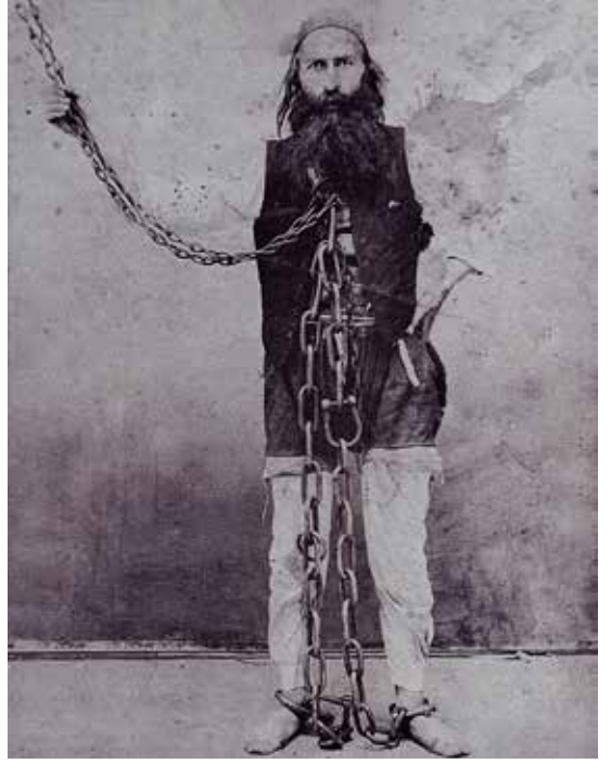
Halide Nusret Zorlutuna'nın babası Alseyit Avnullah El-Kâzımî'nin Sinop Zindanı'nda yedi yıllık mahkûmiyeti sırasında, II.Meşrutiyet'in ilân edilmesiyle ziyarete giden gazeteciler tarafından çekilmiş bir fotoğrafı. (17 Eylül 1908 tarihli Hukuk-u Umumiye gazetesinin ilk sayfası. 40 Kadın 40 Hayat, İBB Kültür A.Ş. Yay. , İst. , 2022)

“İşte 15 yaşındaki güzel kız, böyle bir Avnullah Bey'le yüzünü bile görmeden evlenmek üzere gönderilmiş Halep'e... Bin naz-ü niyaz içinde büyütülmüş Nazlı, yüzünü görmediği, huyunu suyunu bilmediği adama ve İstanbul'dan günlerce uzakta, hiç bilmediği bir şehrin, hiç bilmediği bir ailesi içinde yaşamaya giderken, elbette çok şaşkın, korkulu ve mutsuzmuş.”