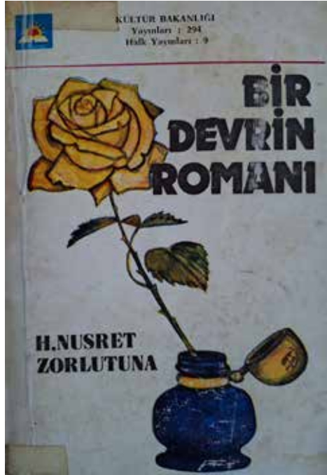
Halide Nusret Zorlutuna'nın hâtıratı: Bir Devrin Romani