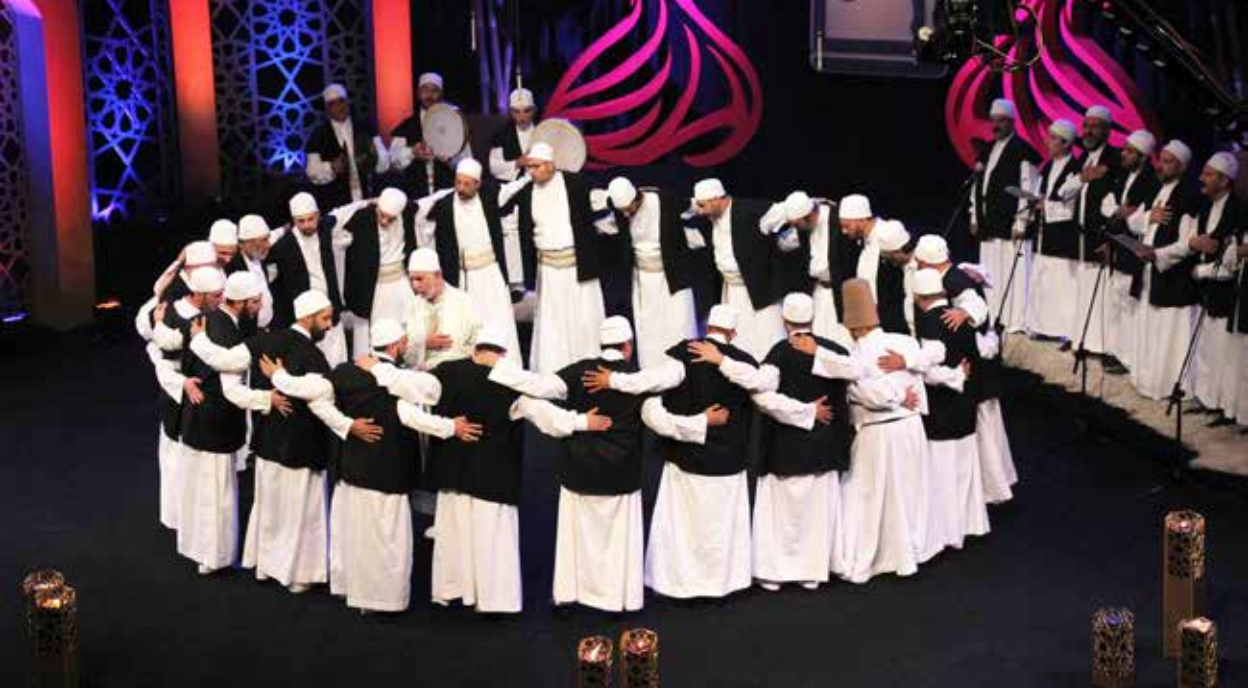
Uluslararası Konya Mistik Müzik Festivalinden bir görünüm