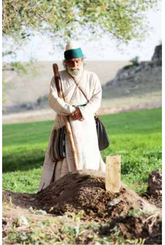
Kervan belgeselinden bir sahne

-“Saraybosna’nın Kalbi Başçarşı”, Yeni İpek Yolu, Konya Ticaret Odası, Sayı: 249, Kasım 2008, s. 60-61.