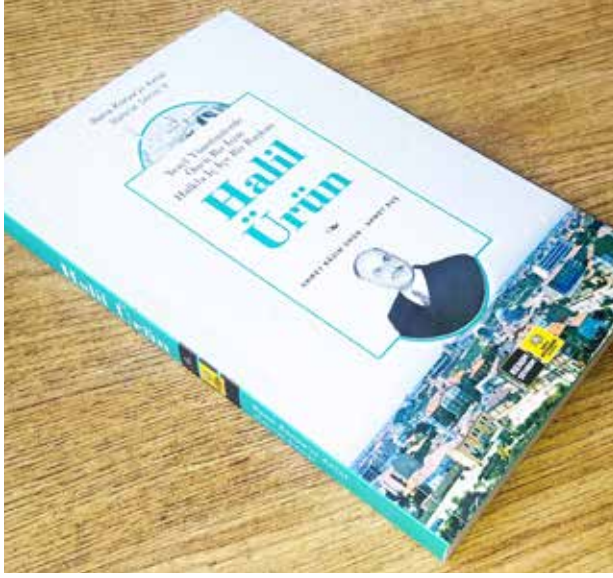
Halil Ürün kitap kapağı