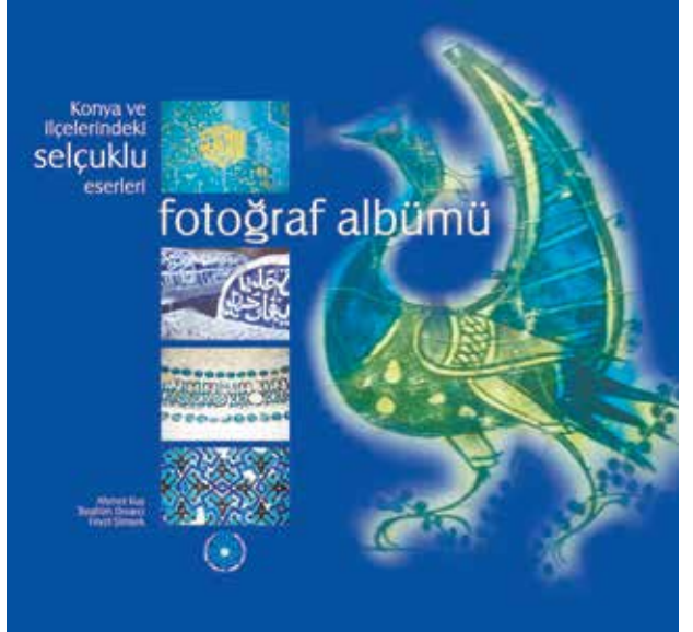
Konya ve İlçelerindeki Selçuklu Eserleri Fotoğraf Albümü kitap kapağı

zel Bir Gece", Çimke Basımevi, 2016, s. 221-223.