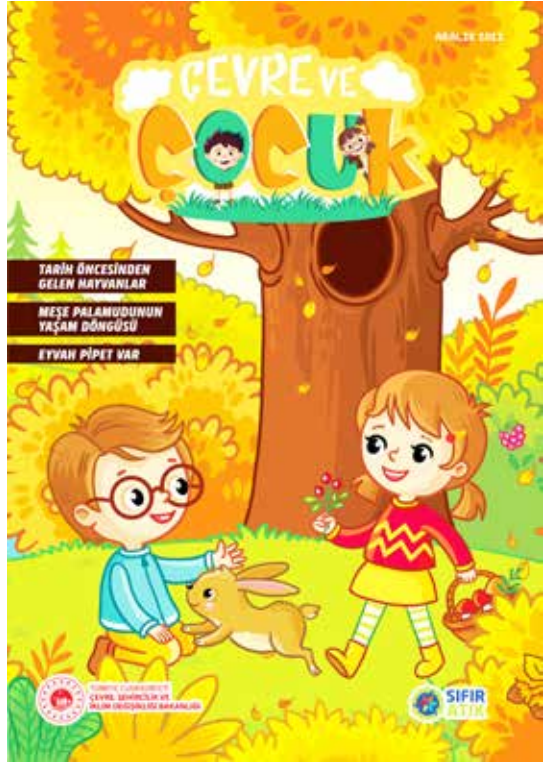
Çevre ve Çocuk dergisi 13. sayısının kapağı

-“Saim Sakaoğlu ve Türk Dili”, Çalı, Sayı: 108, Mayıs 2012, s. 27-28.