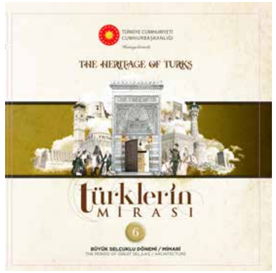
Türklerin Mirası kitap kapağı