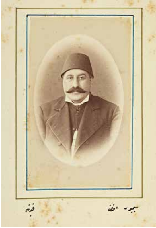
Foto Behçet adıyla Konya'da faaliyet gösteren stüdyo 15 Mayıs 2009 tarihinde kapandı. Stüdyo kapandığı zaman sahibi Yılmaz Oğul idi. Konya'nın ilk fotoğrafhanelerinden biri olan Foto Behçet'e ait eşyalar ve fotoğrafların bazıları hâlen Koyunoğlu Müzesi'nde sergileniyor.

Elektrik enerjisinin kullanılmaya başlamasıyla birlikte Konya'daki fotoğrafhaneye sayısı da arttı. Çatı katlar ya da teraslarda bulunan ilk fotoğrafhanelerde gün ışığı ile çekim yapılıyordu. Konya'da gayrimüslimler kadar Türkler de fotoğrafçılığa ilgi gösterdiler. 1920'li yıllardan itibaren Müslümanlar da Konya'da fotoğrafhaneye açmaya başladılar. Bu ilk fotoğraf stüdyoları arasında Foto Hamid, Foto Afitap, Foto Ektem, Foto Sağlık, Foto Aile'yi