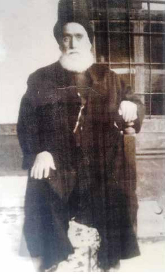
Filibeli Sıdkı Dede