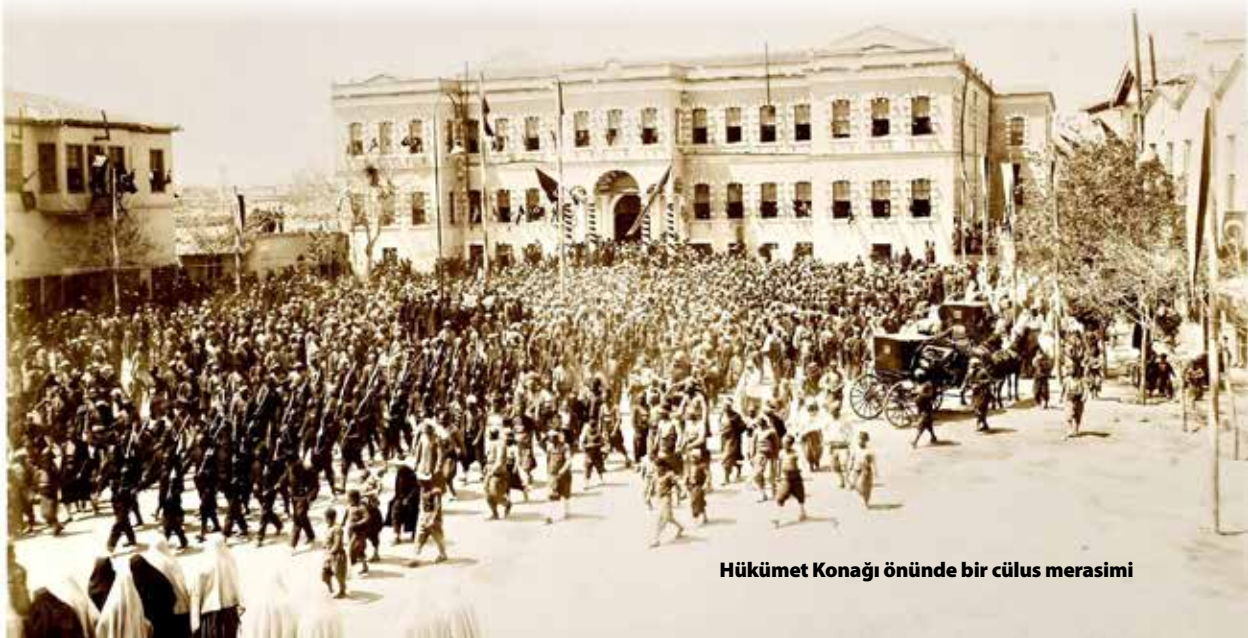
Hükümet Konağı önünde bir cülus merasimi