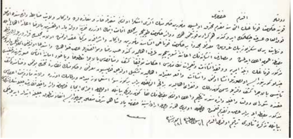
Belge Nu. 18

miş ve mesârif-i inşâ'iyeniñ i'âneten tesviyyesiçün taraf-ı ahâlîden kendü hüsn-i rızâ ve muvâfakatlâ-rile arz-ı hâhiş ve istid'â olunduğu añaşılmiş idüğinden mezkûr konağıñ ebniyye-i emîriyye ve vukûfiyye inşâ'at ve ta'mîrât nizâmnamesi ahkâkımına tevfiқан keşf ve münâkasası bi'l-icrâ maktû'an veyâhûd emâneten inşâsı sûretlerinden kangısı hayırlı görüliyor ise ol suretle inşâ olunmak ve inşâ'at-ı vâkı'a mu'teberân-ı ahâlîden teşkil olunacak komisyon ma'rifeti ve hükûmetiñ nezâreti tahtında bulunmak ve hitâmında keşf-i sânisî bi'l-icrâ keşf defterile resmi gönderilmek ve fukarâ-yı ahâlîden bir akçe alınmamakla berâber bir güne sû-i isti'mâlâta meydân virilmemek üzere vilâyete me'zûniyyet i'tâsı hakkında Şûrâ-yı Devlet Dâhiliyye Dâiresinden tanzîm ve i'tâ olunan mazbatanıñ leffen gönderildiği beyânile ol-vec-hile icrâ-yı icâbı husûsuna dâ'ir Dâhiliyye Nezâret-i celîlesiniñ tezkiresi mezkûr mazbata ile berâber arz ve takdîm kılınmış ol-mağla ol-bâbda her ne vechile irâde-i seniyye-i hazret-i pâdişâhî şeref müte'allik buyrulur ise in-fâz-ı mantûk-ı celîline ibtidâr idileceği beyânile tezkire-i senâverî terkîm olundu efendim fi 7 Şevvâl