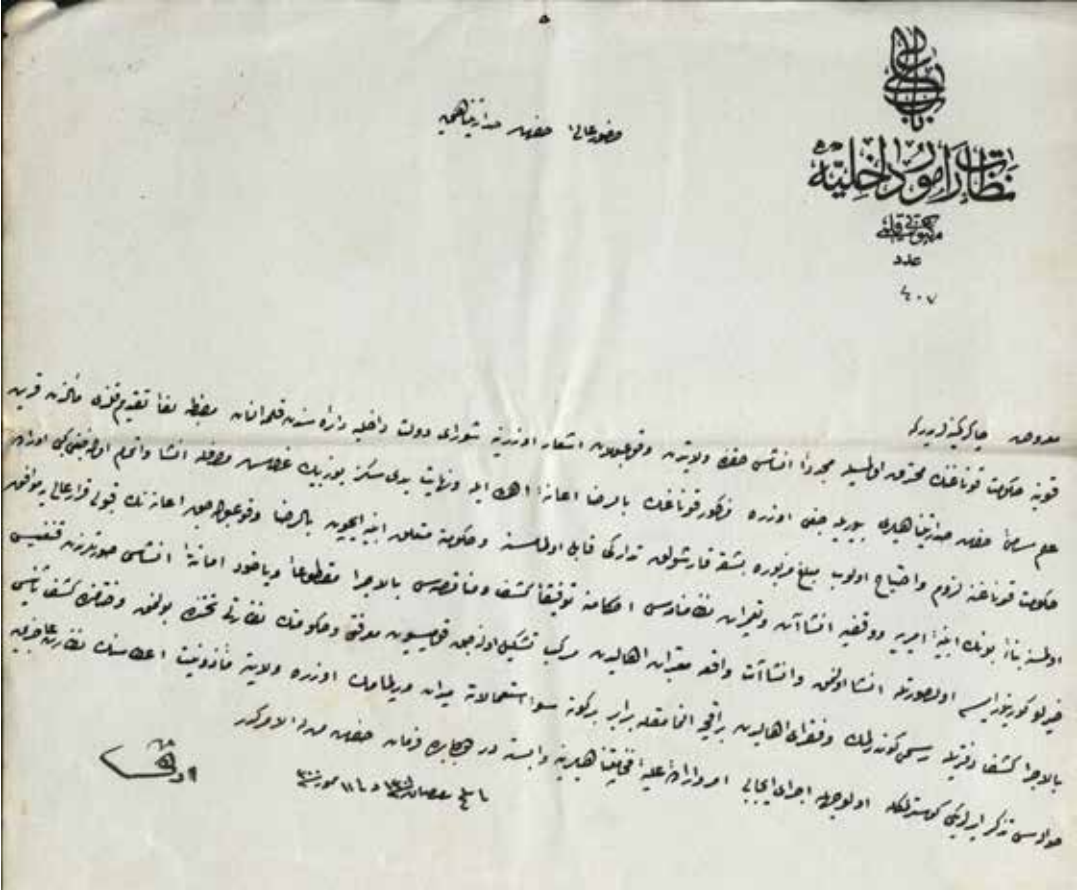
Belge Nu. 17