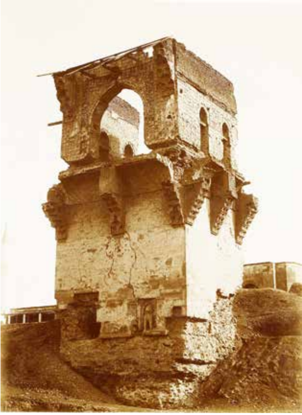
Alâeddin Köşkü kalıntısı (Garabed Solakian-1890'lar)

larına, Konya'nın Osmanlı eline geçmesiyle de ilk Osmanlı valilerine hizmet etmiştir.