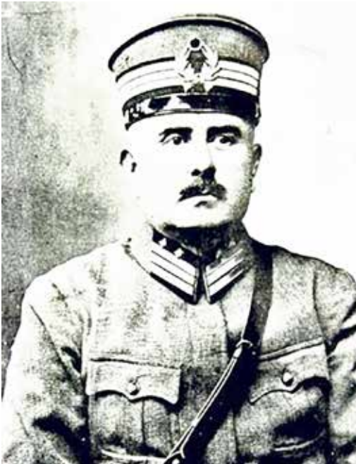
Kazım Karabekir Paşa

Cihan Harb'i'nin bitiminden yaklaşık bir buçuk yıl sonra Kurtuluş Savaşı patlak vermiştir. İsmail Çavuş için tekrar cephe yolu görünmüştür.. Yunanlılar Afyon'a kadar gelmişlerdir. İsmail Çavuş, İsmet Paşa ile büyük taarruza katılmıştır. Yine bir gün yüzbaşı İsmail Çavuş'u yanına çağırmıştır. İki yüz kadar esiri yanına alıp, askerlerle birlikte Manisa Kırkağaç'a esir kampına götürmesini kendisine emretmiştir. Yola çıkarlar ilerledikçe acıkmışlardır. İsmail Çavuş yol üzerindeki köyler-