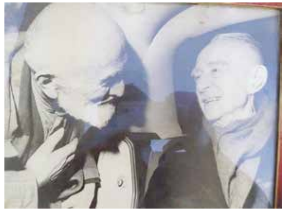
Gazi Ak Mehmet ve İnönü Vedalaşırken

den erzak toplar, kendisinin Bulgarlara esir düştüğü günler gözünün önüne gelir ve gönlü esirlerin aç olmasına razı olmamıştır. Onlara da bu erzaklardan dağıtır ve karınlarını doyurur. Bir hafta sonra Manisa'ya varıp esirleri kampa teslim etmiştir.