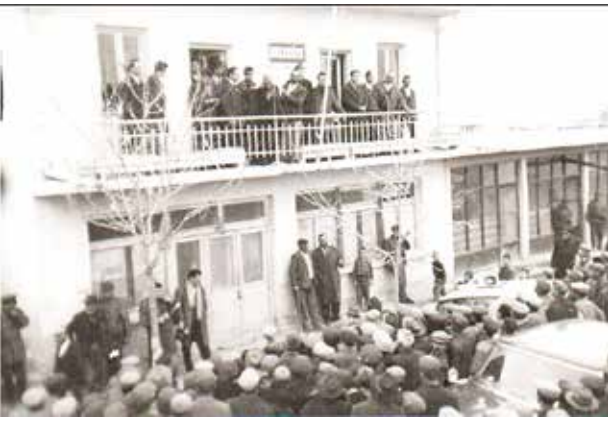
İsmet İnönü'nün İsmil Ziyaretinde Halka Seslenişi

dan yıllar geçmesine rağmen silah arkadaşını belediye binasına davet ederek hasret gidermiştir. Belediye binasının balkonundan halka seslenen İnönü, “Sizinle iftihar ederim. Her haliniz bana görgülü, bilgili, medeni göründü... Buranın insanı demir gibi sağlam karakterlidir” (1) diyerek halkı da selamlamıştır.