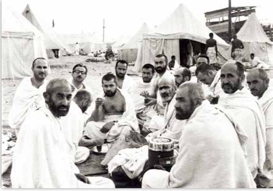
1962 Haccında Arafat'ta Hacılar

kitaplara bakalım dedi. Ayaklı merdiveni getirdi tavana kadar dayanan kitap raflarından büyük büyük hacimli kitapları çıkardık yere oturarak o hadisleri orada bularak gerekli notları aldım. Misafirlerle sohbet ederken de Kâbe'de bir namaz yüz bin namaz Ravza-i Mutahhara'da bir namaz bin namaz buyurdu. Misafirler gidince sordum Kâbe'de bir namaz yüz bin namaz dediniz. Kâbe'de bir günlük kaza kılsak, namaz borçlarımız var, yerine geçer mi hocam? Hüseyin'im bor borç-