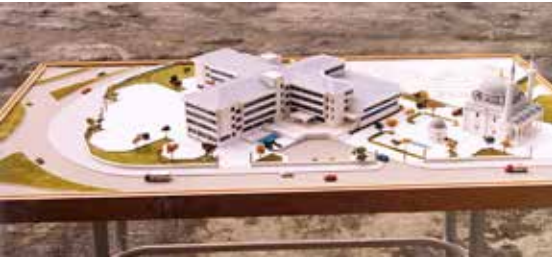
Anadolu İmam Hatip Lisesi Maketi

15-20 yıl önce bir kurban bayramında inek et kombinasında kesilmişti, biz de organize sanayindeydik. “İneğin işi tamam” haberi geldi. Hacı babamla beraber arabayla Et Kombinasına gidiyoruz çevre yolundayız, Anadolu İmam-Hatip’e yaklaşıncı Hacı babam söylenmeye başladı. 28 Şubat kararları yeni alınmıştı nereye gidecek bu çocuklar. Zavallıların önlerini kesiyorlar, okullarını kapatmak istiyorlar diyerek hem söyleniyor hem ağlıyordu. Çünkü okul yaptırma der-