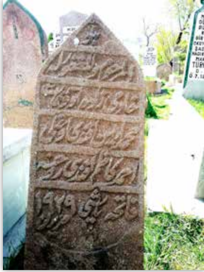
Ahmet Kazım Bolay'ın mezar taşı

5, Türkçe 7, musahabat 7, tarih 5, coğrafya 5, hesap 5, tabiat 7, Resim 6, El işleri 6, Yekûn: 57.