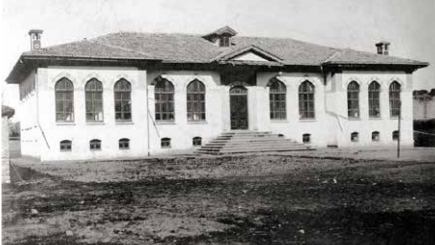
Cumhuriyet ilk mektebi.