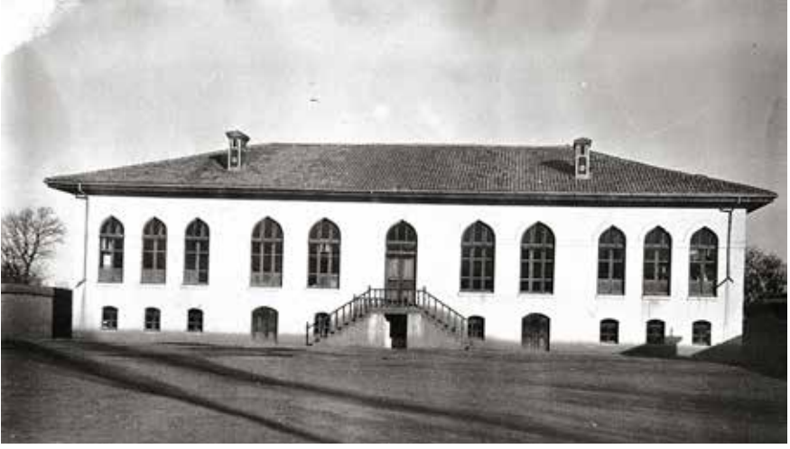
Cumhuriyet ilk mektebi.