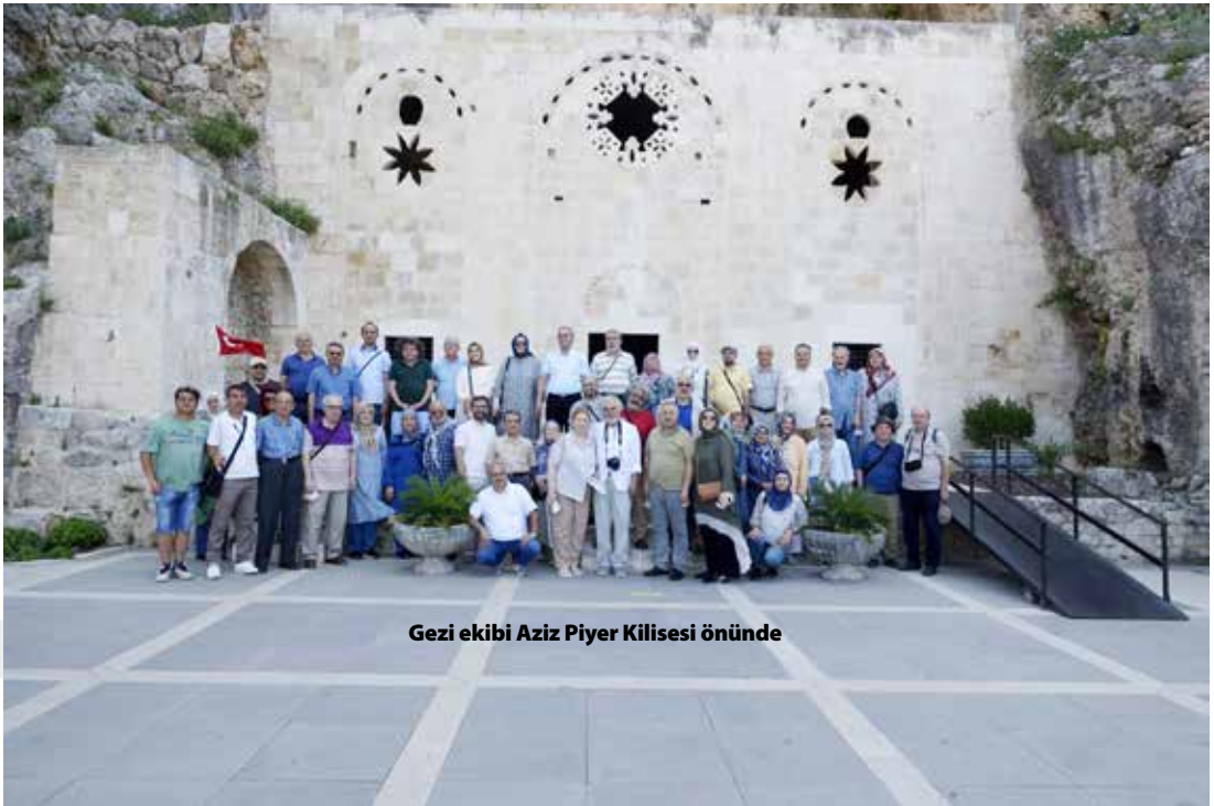
Gezi ekibi Aziz Piyer Kilisesi önünde

Cumartesi sabahı kahvaltı sonrası tekerimiz St. Pierre (Aziz Piyer) Kilisesi için döndü. Mezkûr kilise