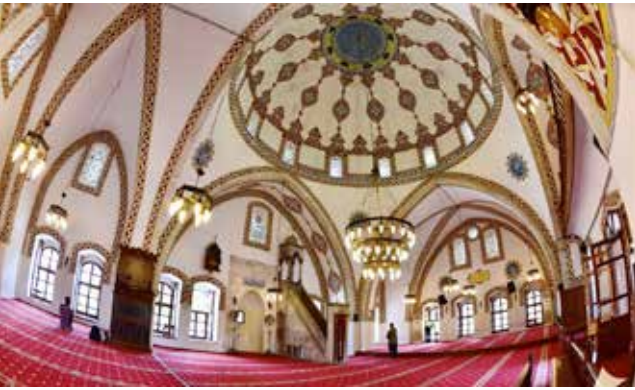
Habib-i Neccar Camii harimi ( https://www.kulturportali.gov.tr/medya/fotograf/fotodokuman/7906 )

Külliyedeki ikinci türbe ise avluya girildiğinde, kapının hemen güneyinde, ona bitişik konumda. Batıya bakan basık kemerli giriş kapısının üzerinde taş levha üzerinde yazılı sekiz satırlık kitabe bulunan türbe, dörtgen planlı. Girişin sağında (güneyde), Hz. Yahya (Yuhanna) ve Hz. Yunus'a (Paulos) (Yasin Suresi'nde sözü edilen iki elçi olduğuna inanılan kişilere) atfedilen çift kavuk başlıklı taştan bir sanduka yer alıyor.