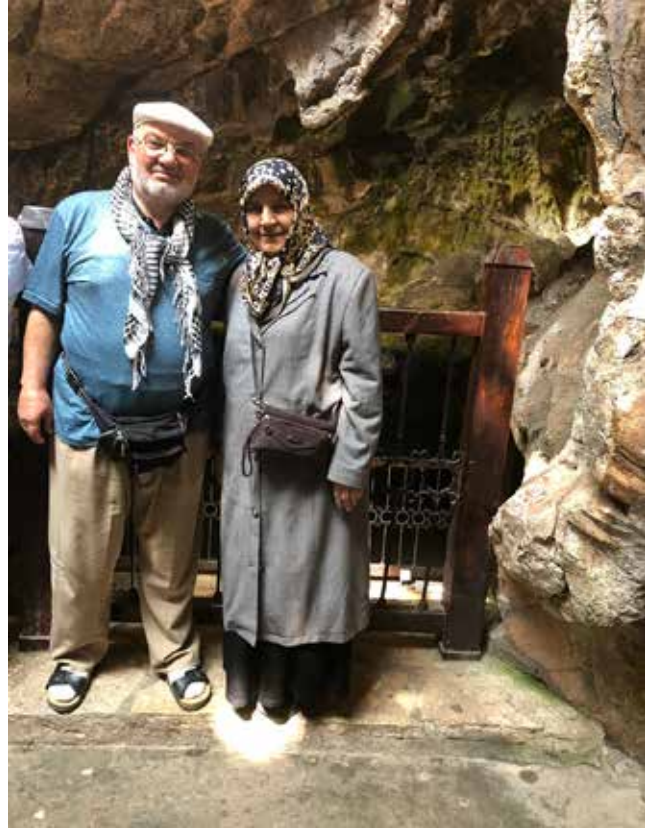
Ashab-ı Kehf Mağarası

Ashab-ı Kehf Mağarası'nı ilkin bir gezi grubuyla seksenli yıllarda, ikinci olarak da ailemle 2004 yılında ziyaret etmiştim. Son ziyaretimden bu yana Tarsus o kadar büyümüş ki o zamanlar şehir merkezine on iki km mesafedeki ıssız bir mevkide olan mezkûr mağarayı, günümüzde âdetta kollarıyla sarmış. İşte on sekiz yıl