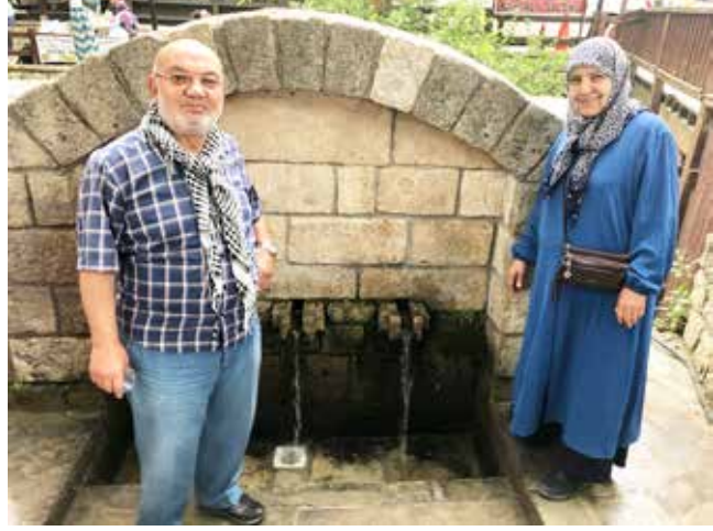
Ab-ı Hayat Çeşmesi

İstanbul-Halep-Şam-Hicaz yolu üzerinde, Hac ve İpek Yolu ker-