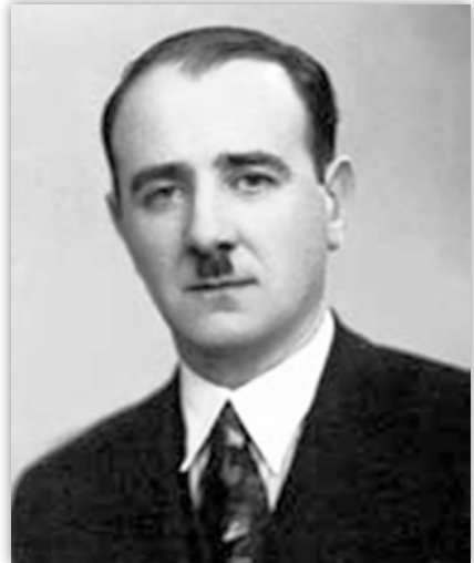
Mehmet Fuat Köprülü