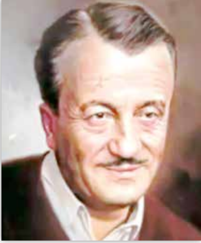
Necip Fazıl Kısakürek