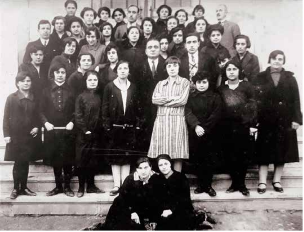
Kız Muallim Mektebi Öğrencileri

ça bulunduğumuz yıl, Yunus'un yaşadığı tarihin 640. yıl dönümüdür. Bu dönüm yılı içinde bu günün seçilmesine gelince, bunun için şairin şiirlerinde tasavvuf renkleri arasında yaşatılan ve şiirin en galip unsuru olan tabiat güzelli düşünmeli, bu görüşle 15 Nisan'ı Yunus'u Anmak Günü yapmalıdır.