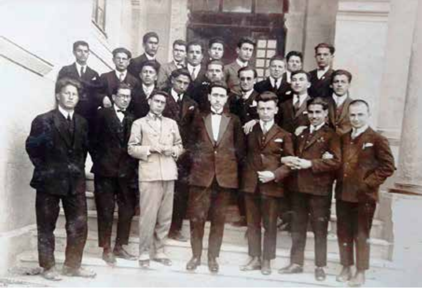
Erkek Muallim Mektebi Öğrencileri

Kolordu kumandanı Paşa Hazretleri bandonun ihtifale iştirakini (katılmasını) emir buyurmak suretiyle kahraman ve mümtaz (seçkin) ordumuzun memleket irfan ve harsine (kültürüne) karşı olan çok kıymetli hassasiyet ve alâkasını izhar etmiş (açığa çıkarmış) oldu. İhtifal merasimine saat on yedide başlanmıştır.