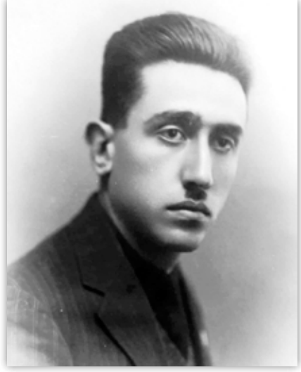
Sadeddin Nüzhet Ergun