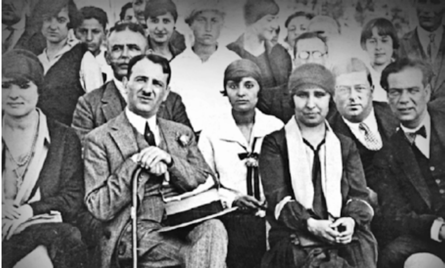
Mehmet Fuat Köprülü