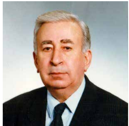
Mehmet Önder (1926-2004)