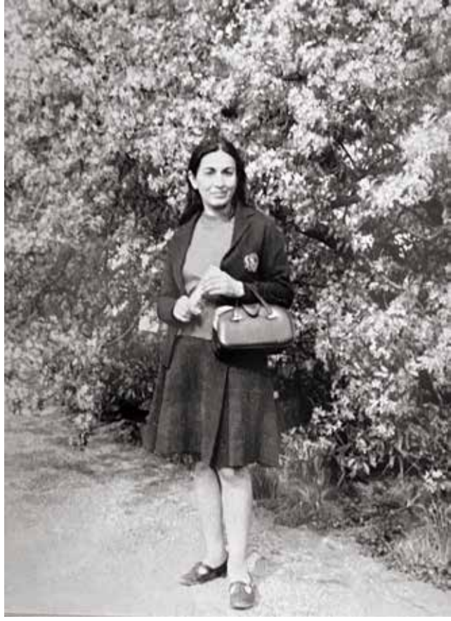
Zuhal Hanımın gençlik yıllarından bir fotoğraf

Sonra dedem annemi Ankara’ya getirmiş, annem İlkokul, ortaokul ve liseyi orada okumuş. Baba tarafım da hep askermiş. Babamın babası Sarıkamış şehidiydi. Kardeşleri de as-