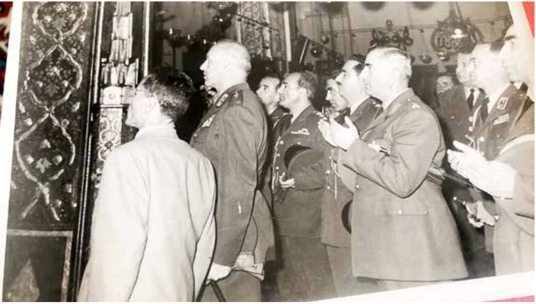
Bir yabancı askeri misyon heyetine müzede bilgi verirken.