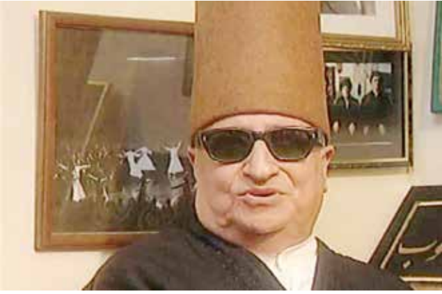
Kani Karaca (1930-2004)