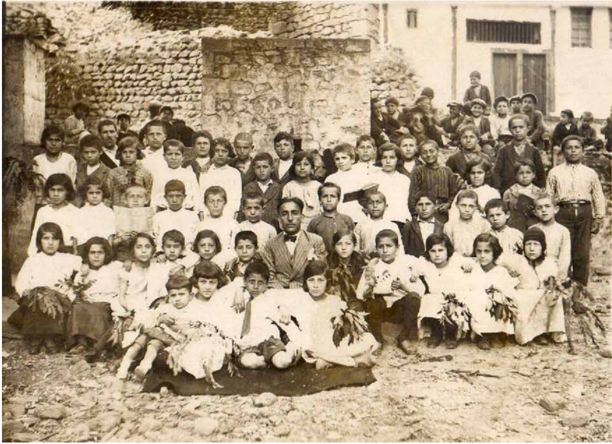
Nikser Gazi Ahmet İlköğretim Mektebi Öğrencileri

bümüne koydu, o kadar saklıyordu ki, “Böyle bir adam bir daha bulunmaz.” derdi. Nasıl kafası alıyordu, nasıl bu kadar tafsilatlı bilgiye sahipti hayret ediyorum.