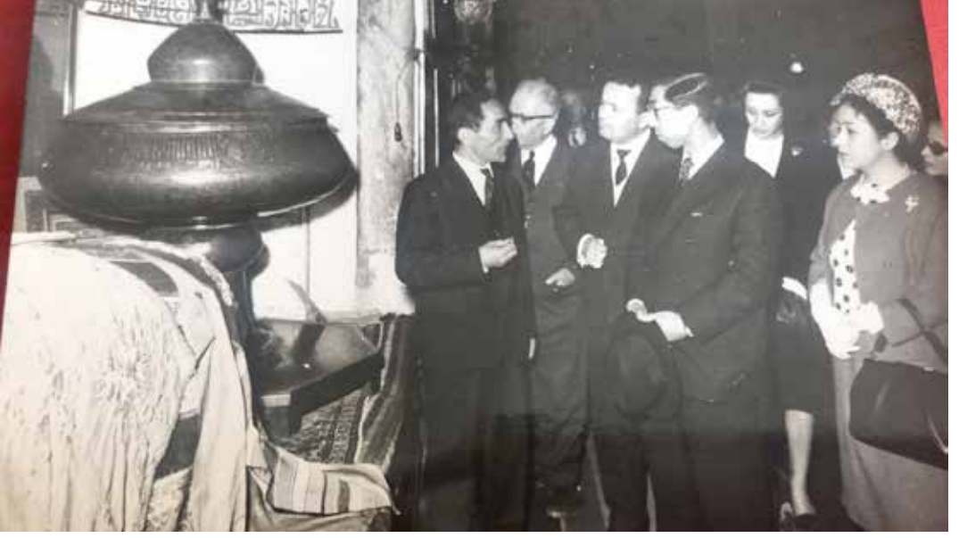
Türbeyi ziyaet eden Japon prensine bilgi verirken

niz diye. Şimdi Dergâh'ın bahçesinde sigara içiyor insanlar, izmaritlerini yerlere atan bile var. Böyle şeylere müdahale edilmesi gerekir.