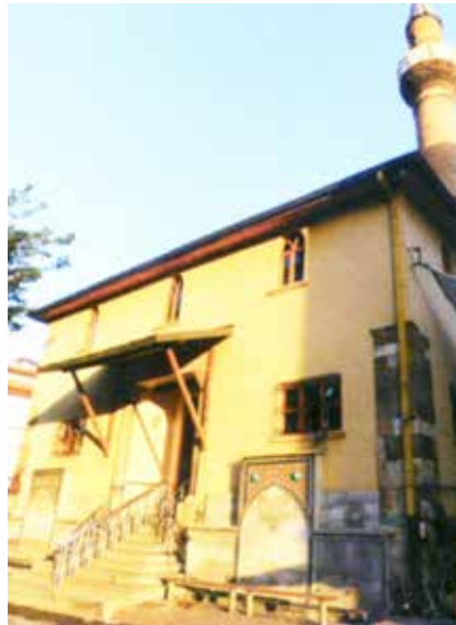
Hacı Hasan Camii