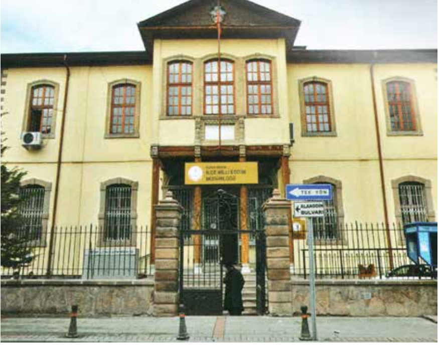
Meram İlçe Milli Eğitim Müdürlüğü Binası

otopark var, sur o otoparkın ortasından geçer. Ondan sonra Karma Ortaokuluna doğru biraz sağa doğru meyleder. İmam Hatip okulunun önünden doktorlar sitesine doğru devam edip sola döner. Mareşal Mustafa Kemal Ortaokulunun önünden Zindankaleyi içte bırakacak şekilde döner, Gazi (Konya) Lisesine gider, o cadde üzerinden devam eder doğuya doğru kıvrılır ve Sahibata'nın önünde birleşir. Dikkat ederseniz Sahibata caddesi zikzaklı gider biraz, o zikzak dış surun sur duvarlarına paralel gitmesinden kaynaklanır. Buna dış sur diyoruz.