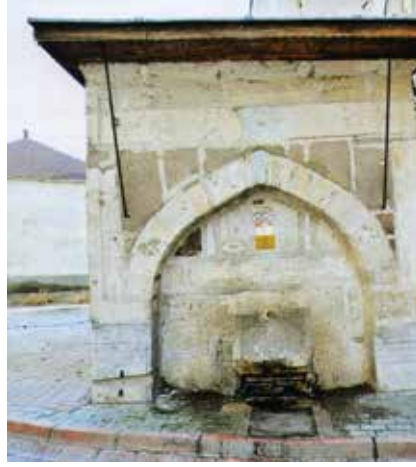
Kalecelp Mahallesi Çeşmesi