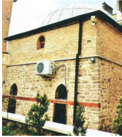
Erdemşah (Kalecelp) Mescidi