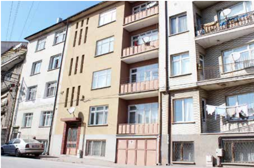
Ahmet Fakih Türbesi üzerine dikilen bina.