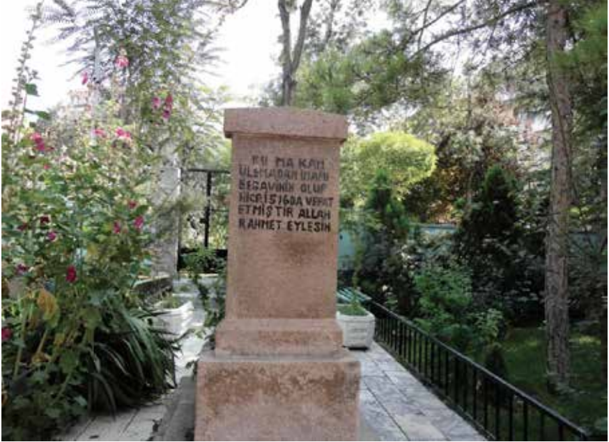
Konevî Türbesi yanına kaldırılan İmam Begavî'nin kabri.

Türbe, Amber Reis Caddesi üzerinde, Turgutoğlu Sokağı'nın girişindeki sol köşededir. Türbe 1950'li yılların başında yıkılarak yerine Ziraat Müdürlüğü lojmanları yapıldı. Türbedeki kemiklerde Sadreddin Konevî Türbesi'nin yanına kaldırıldı.