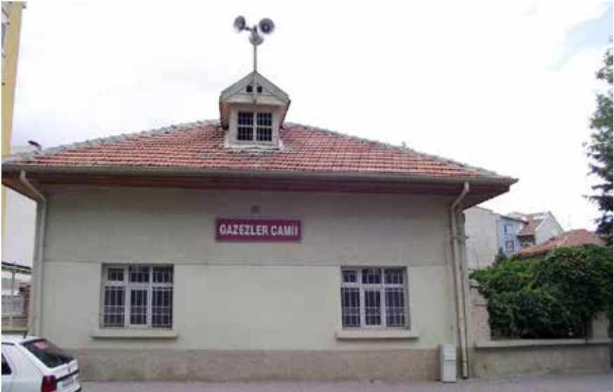
Tekke Gazelers caminin yanındaydı.

İşte böyle... Onun içindir ki, o güzelim ilahi ve Na't-i şerifleri duyduğum zaman, o "tatlı, zarrarsız, faydalı" günleri hatırasını yaşar, kendi kendime "Tekkeler kapatılmasaydı' ne olurdu acaba?" diye düşünürüm.