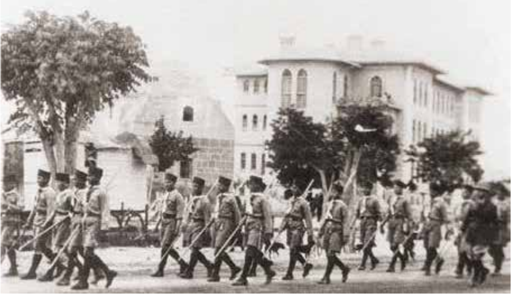
Amber Reis Türbesi ve Konya Lisesi.