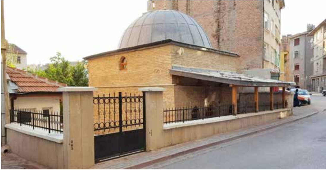
Erdemşah Mescidi'nin genel görünüşü.