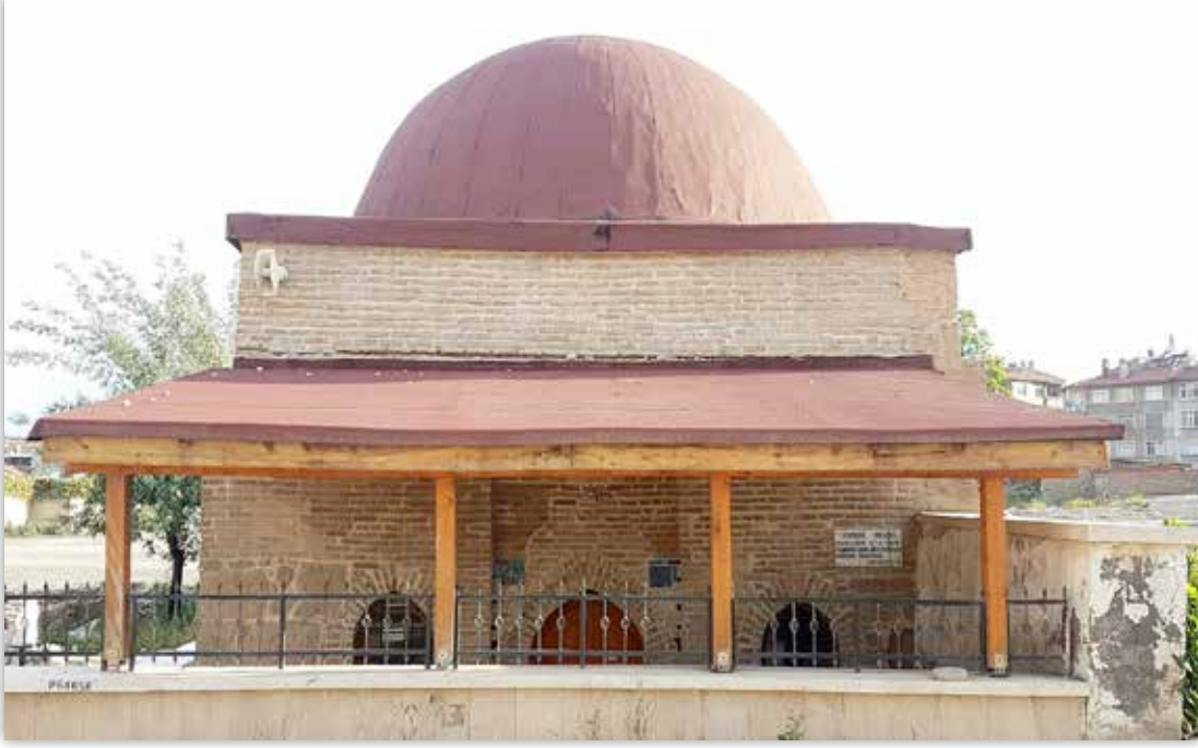
Kalecelp Sultan Türbesi, Erdemşah Mescidi'nin kiblesindeydi.

Günümüzde de mescide bitişik evler istimlak edilerek mescidin etrafı açılmıştır.