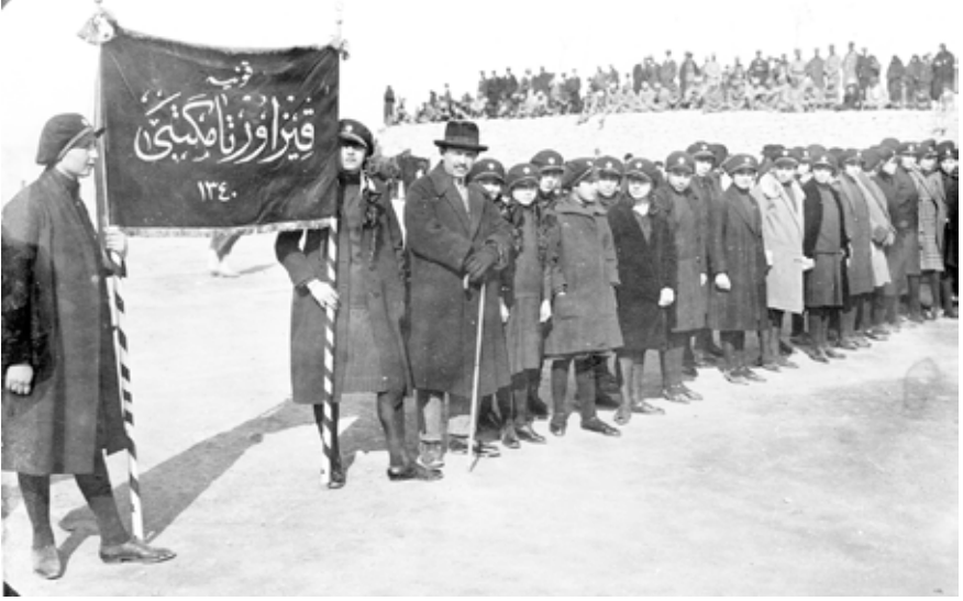
Konya Kız Orta Mektebi - 1927