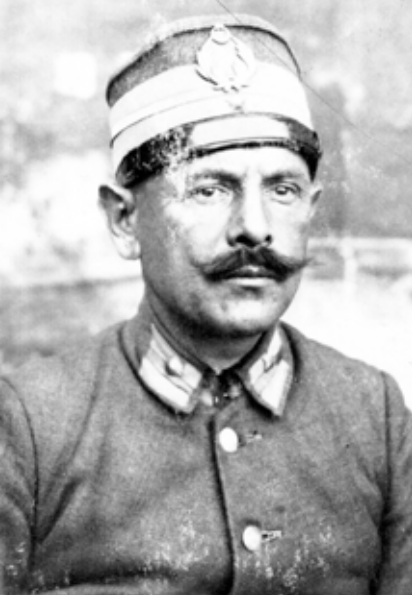
Vatanperver Celal Hoca

bu senede Namık Kemal merhumun “Celaleddin Harzemşah” adındaki o piyesini işitmiş ve Mümtaz’a söylemiştim. Bu vefalı arkadaş hemen kitabı bana getirmişti. Dokuz perdelik ve bir şaheser olan bu kitabı okumaya koyuldum. Hatıralarımda yanılmıyorsam ezberlercesine iki-üç defa okumuştum ve ona da kanmayarak o zaman ucuza satılan donuk renkli pencere kâğıtlarından bir haylice satın aşarak kitabı baştanbaşa kopya etmiştim. Tam bu sırada hem mürebbitimiz hem de öğretmenimiz olan Abdülgani (Aksoy) Efendi rahmetli hocamız beni suçüstüne yakaladı ve alaylı bir gülüşle kitabı elimden aldı. Böyle bir eseri ve kitabı okumanın yasak olduğunu bilip bilmediğimi sordu ve kitabı alıp götürdü. Hakkımda ceza olarak hiçbir muamele yapmaya kıyam etmemiş ise de Mümtaz kardeşin kitabını kendi kütüphanesine malkayıttığı muhakkaktı. Bende şafağın attığı belli idi. Artık bu korkunç ve acıklı olayı sınıf arkadaşım ve kardeşim Mümtaz Efendi’ye gizlice söyledim. Rahmetli Mümtaz “Ses çıkarmayalım susalım