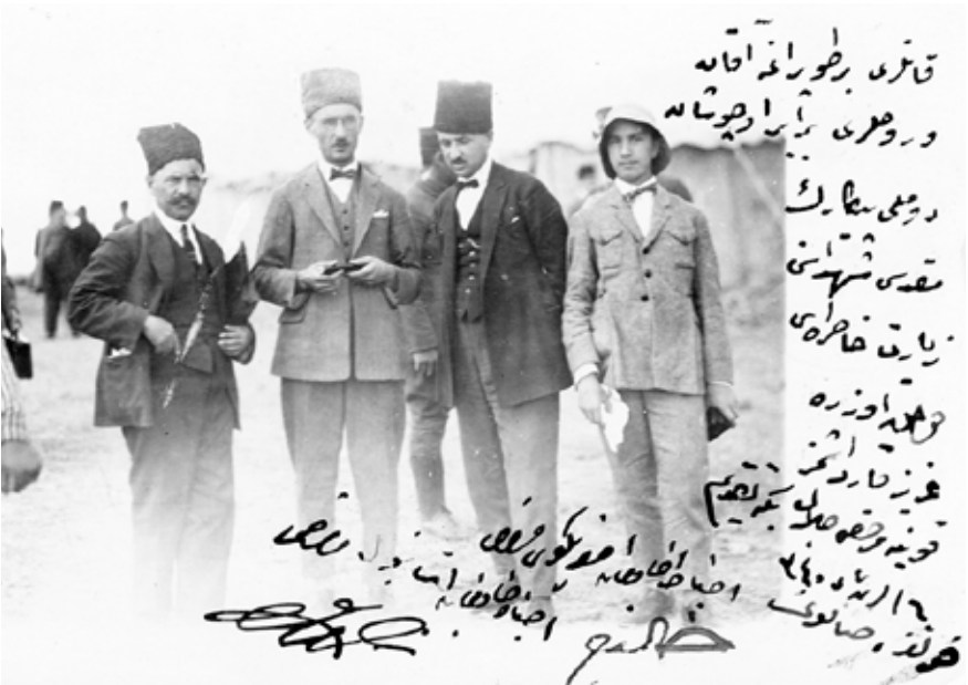
Dumlupınar Şehitliğini ziyaret hatırası 6 Ekim 1924