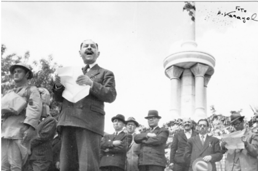
Alaaddin Şehitler Anıtı - 1936