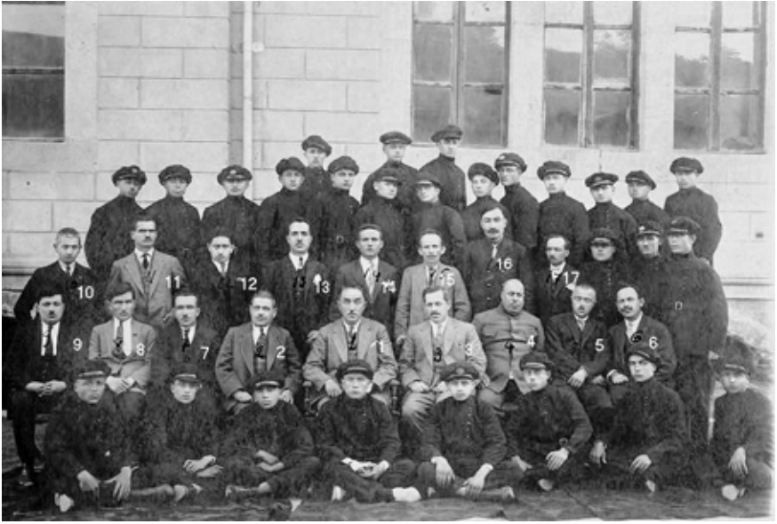
Konya Sanat Mektebi, 1928