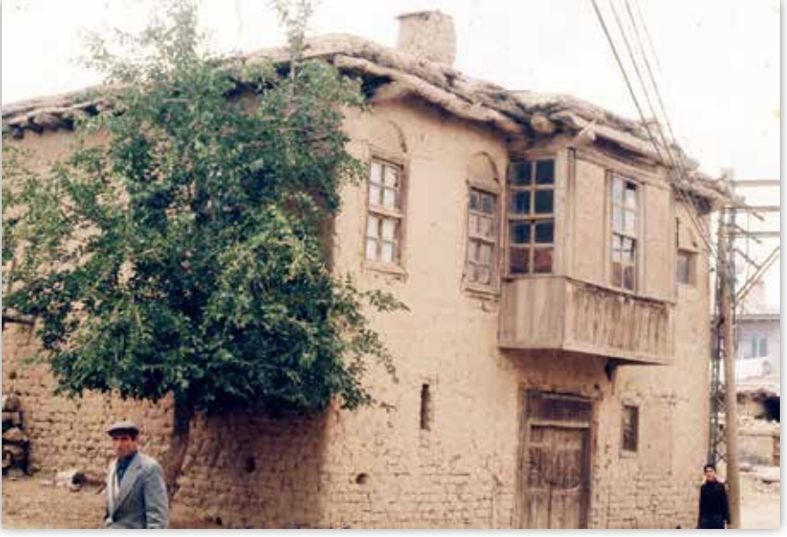
Çavuş Köyünden Bir Ev

iyi bilen insan yetiştirmek, ülke-bölge-şehir-köy kalkınmasına katkı yapmak, mimarlık ve kültür-sanat eserlerini korumak-yaşatmak gibi başlıklandırabiliriz.