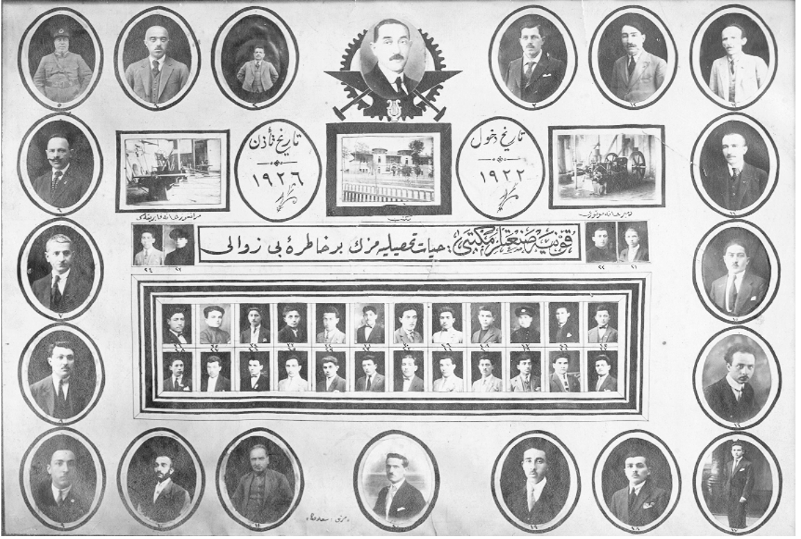
Konya Sanat Okulu.