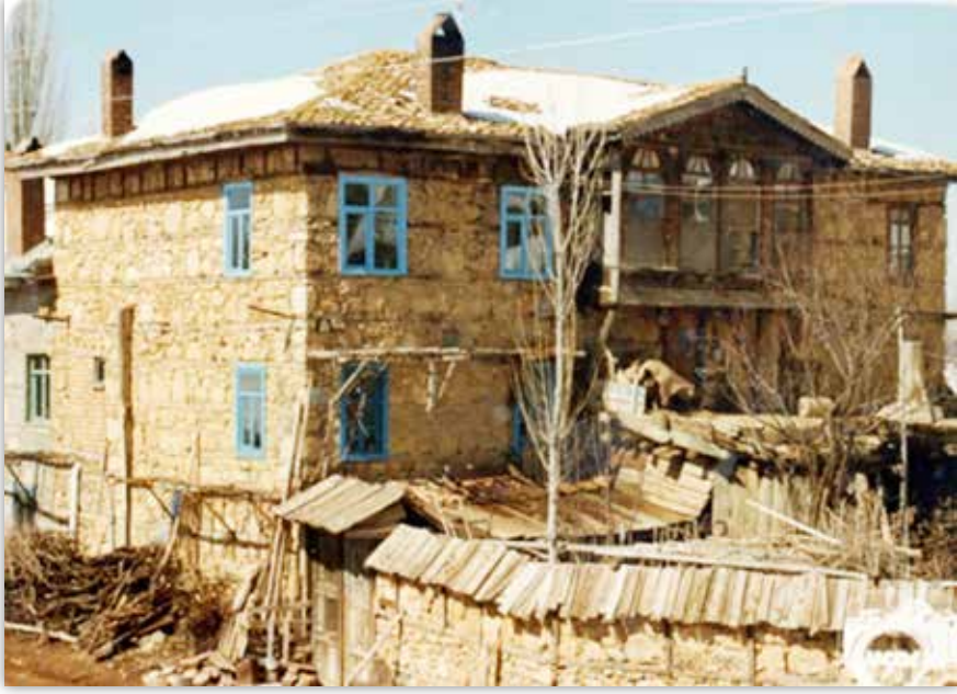
Üstünlerden Bir Ev