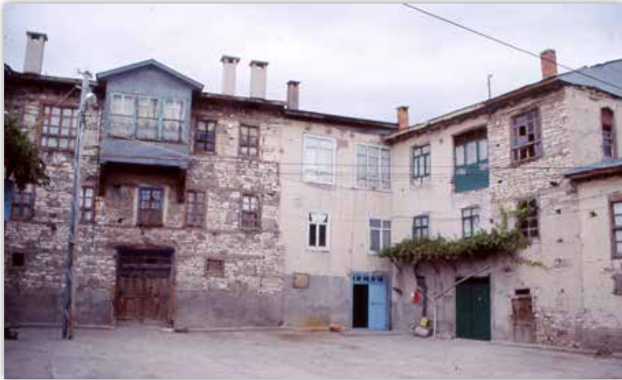
Doğanbey'den bir görünüş

* KTO Karatay Üniversitesi Öğretim Üyesi