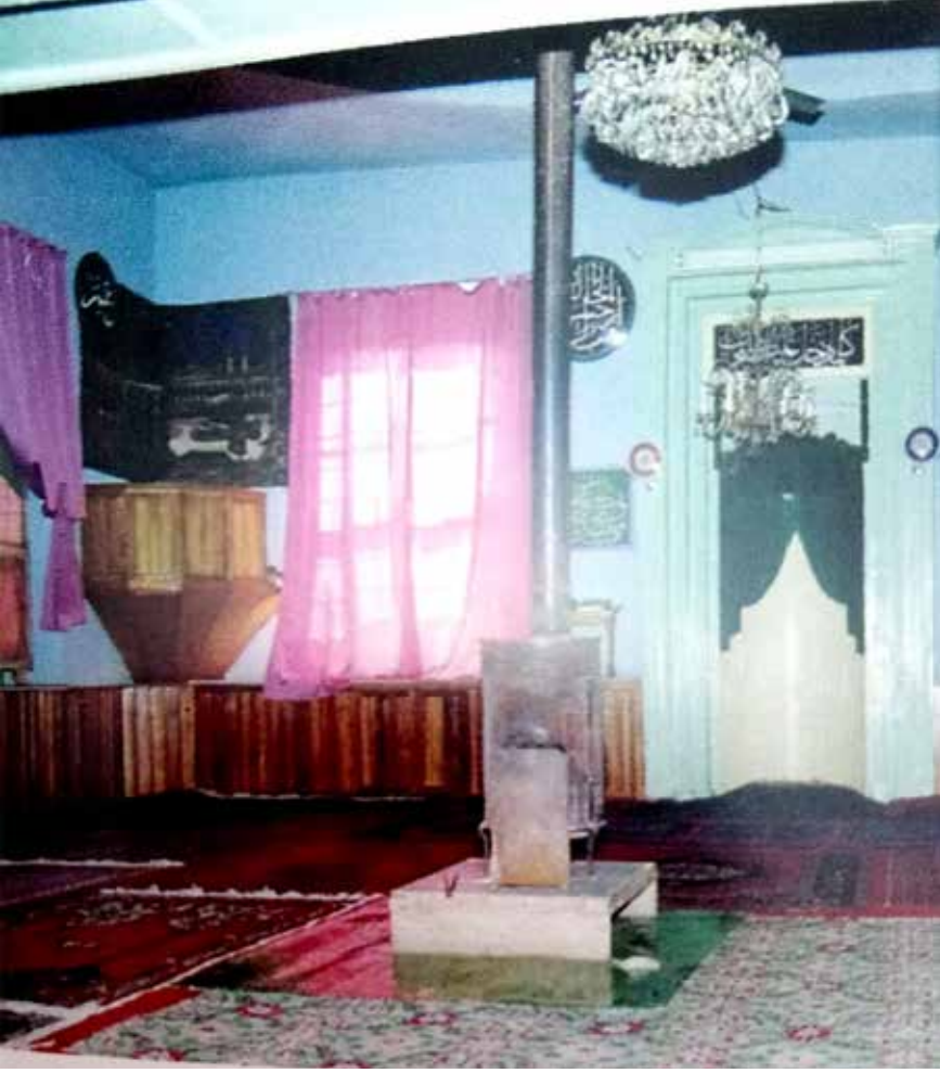
Üç yıl önce yanan Çaybaşı Caddesi üzerindeki tek cami olan Fahrünnisa Camii'nin yanmadan önceki içten görüntüsü