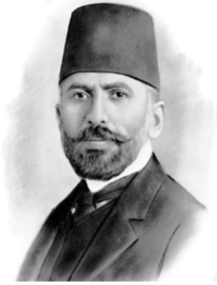
Süleyman Nazif (1869-1927)

Semada makes-i ikbali görmedik- çe vatan,