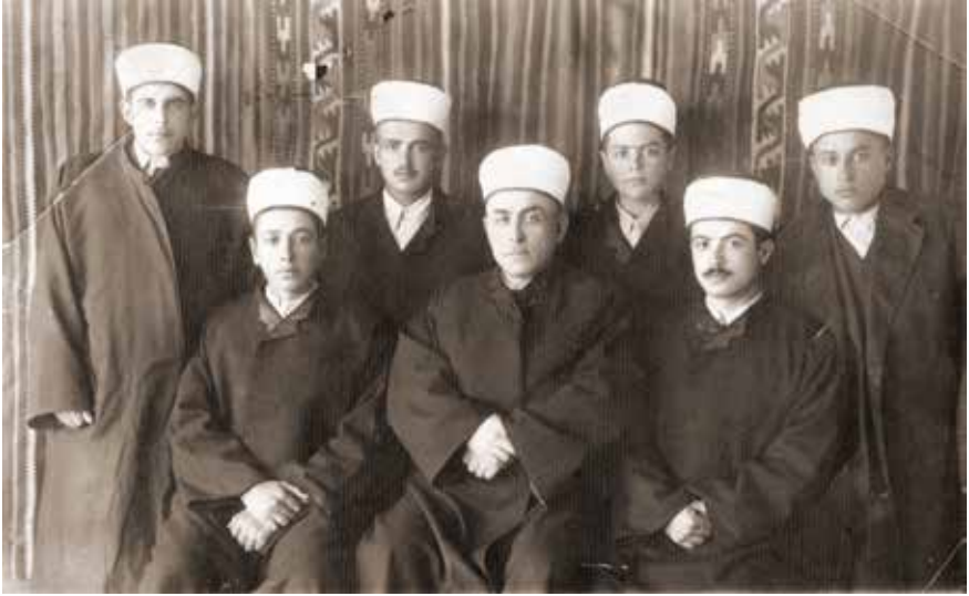
1949 senesi, hafızlık fotoğrafı.

bir sayfa ezber veriliyordu. Sadece iki dönüšte; iki sayfa ezber verildi. Şu sıralarda hafızlık yaparken geçirdiğim uzun zamandan dolayı hayıflanıyorum. Zira benim de şu anda yakinen ilgilendiğim ve içinde bulunduğum bir çalışmada sıradan çocuklar altı, yedi ay gibi bir sürede hafızlıklarını tamamlamaktadırlar. O geçen uzun zamandan dolayı üzülüyorum. Üstelik de 6 ay, günde sadece 2 sayfa yüzünden Kur'an okuyarak zamanım geçmişti. Büyüklerimiz "Vusulsüzlüğümüz, usulsüzlüğümüzdedir" sözü ne kadar doğrudur. Hafızlığımı üç yılda bitirdim. Şayet yol gösterilse daha kısa zamanda hafızlığımı tamamlayabilirdim. Benim hafızlık duam, ben 18 sayfa ezber okurken yapıldı. Bir gün dersimi okuduktan sonra Hakkı Efendi beni çağırdı. Bana; "Sen arkadaşlarından ileri gittin öndekilere de yetişemedin, sen ne olacaksın" dedi. Ben sustum bir şey demedim. Hakkı Efendi tekrar; "Senin de duanı yapsak duam yapıldı diye kaçırır misin" diye sordu. Ben de cevaben, "Hocam inşallah ben hafızlığımı tamamlayacağım, siz nasıl isterseniz öyle yapın dedim." Hakkı Efendi bunun üzerine, "Sen de hanzırlan, senin de duan yapılsın dedi"