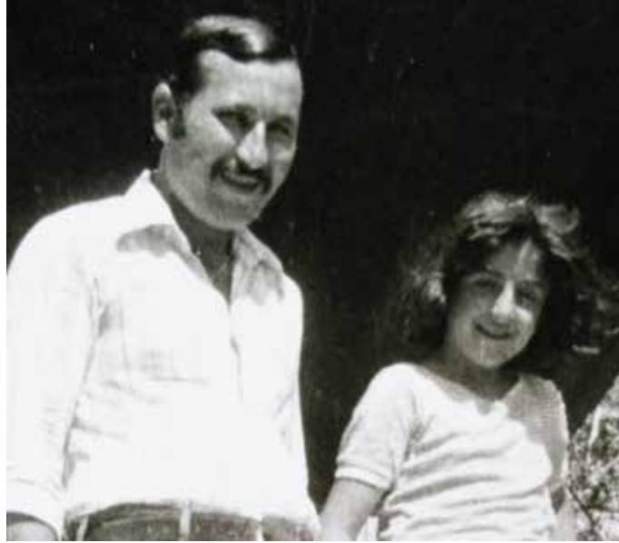
Silifke’den Boğsak’a ve Susanoğlu’na motorsiklet ile gittiğimiz yıllar