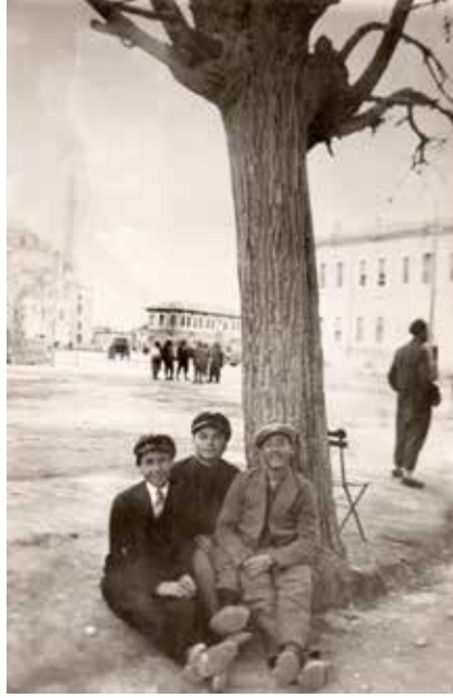
1900’lü yıllar Şerafettin Cami Meydanı.