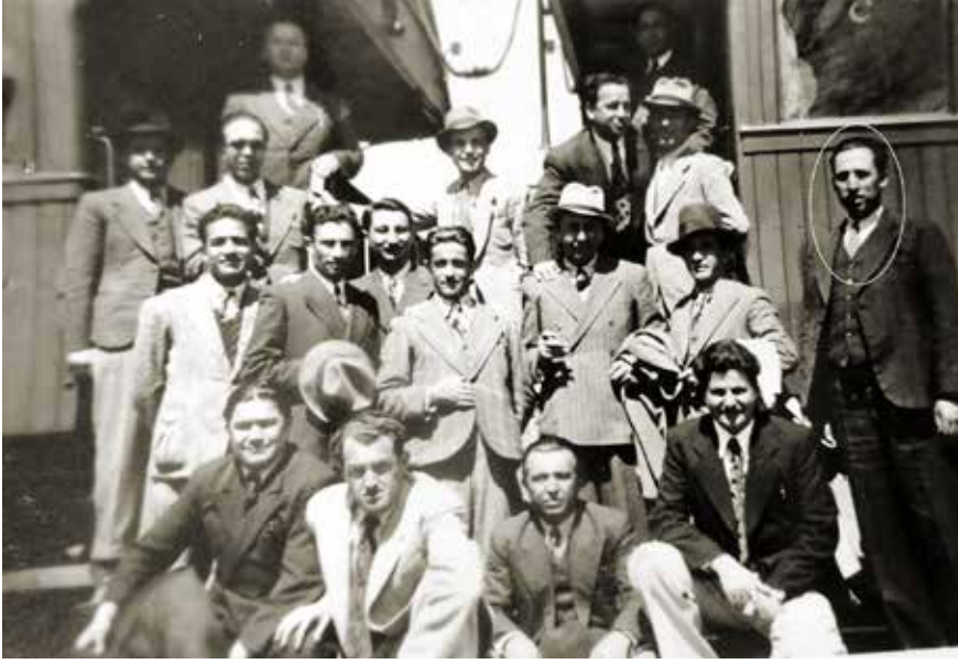
1941 Ankara Etimesgut istasyonu.