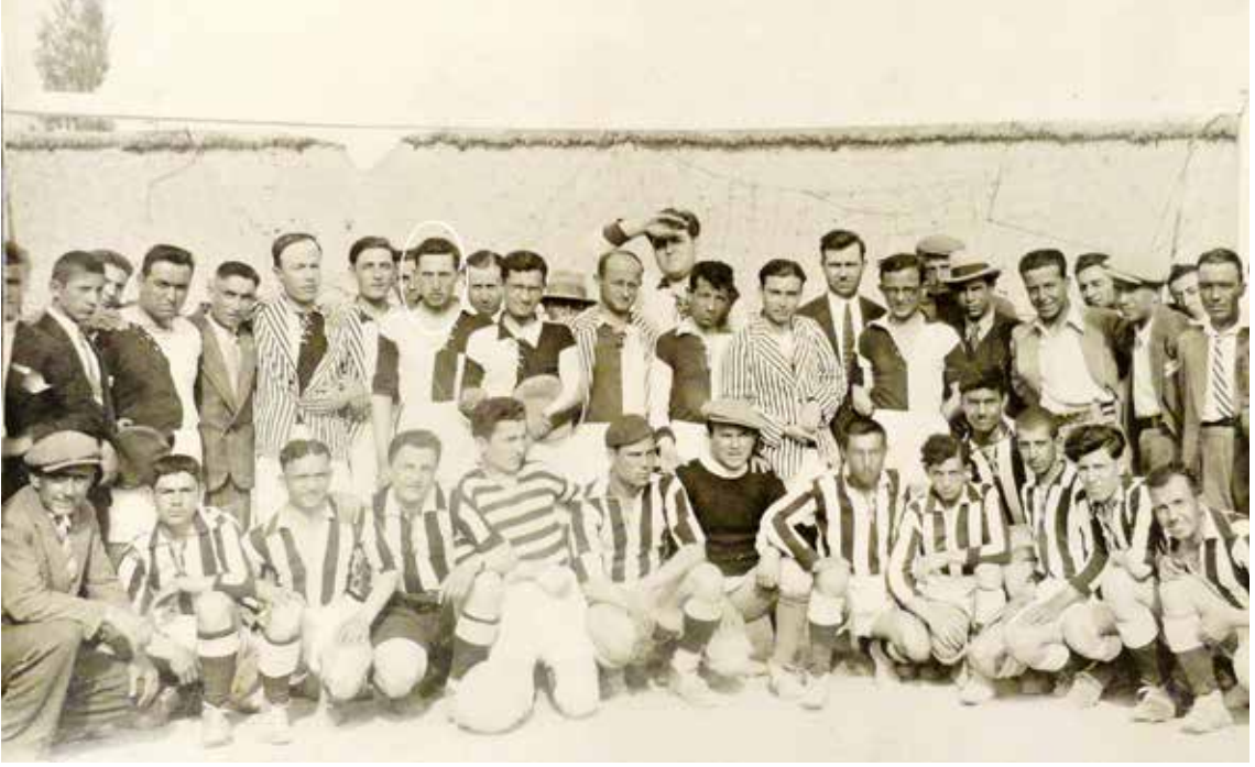
1926 yılı Konya İmam Hatip Mektebi.

yırhahlığın bir örneği idi. Köşede, bucakta çaresiz kalan zavalıları bilir ve bulur ve onlara yardım ederdi. Hastalığının ilk dönmelerinde fakir bir ailenin ziyaretine giden bir dostundan o ailenin durumunu sormuş ondan “ Ne yorganları, ne sergileri var, çok perişan durumdalar ” cevabını alınca çok üzülmüştür. Sonra kendisini çok seven birkaç dostuna haber göndererek bu fakir ailenin ihtiyaçlarını temin ettirmişti. Daha sonra kendisine ziyarete gelen bu fakir genç: “ Oğlum, haliniz öyle pek durgun idi de neye gelip bana haber vermedin ” deyince zavallı fakir ağlamağa başlamış, Üstat da yardımı yapan kimselerin isimlerini birer birer sayarak göz yaşları içinde onlara samimi dualar yapmıştı. Müftü seçimlerinde diğer adaylardan 35 oy fazla almasına ve Diyanet Reis-