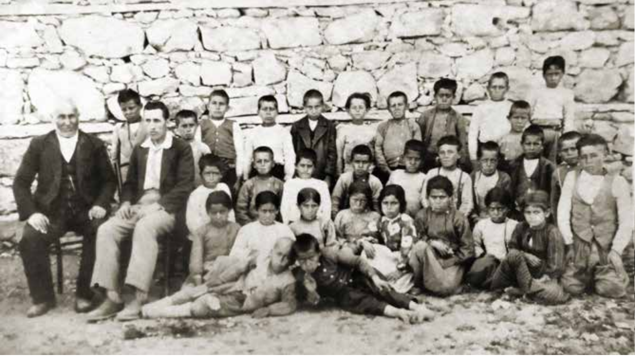
1932 Çumra Dinek İlkokulu