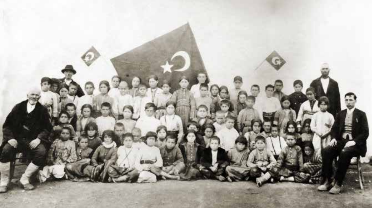
1933 Afyon Bağlıca İlkokulu.

detnamesi almaya istihkak kazanmış olduğundan işbu şahadetname verilmiştir.”