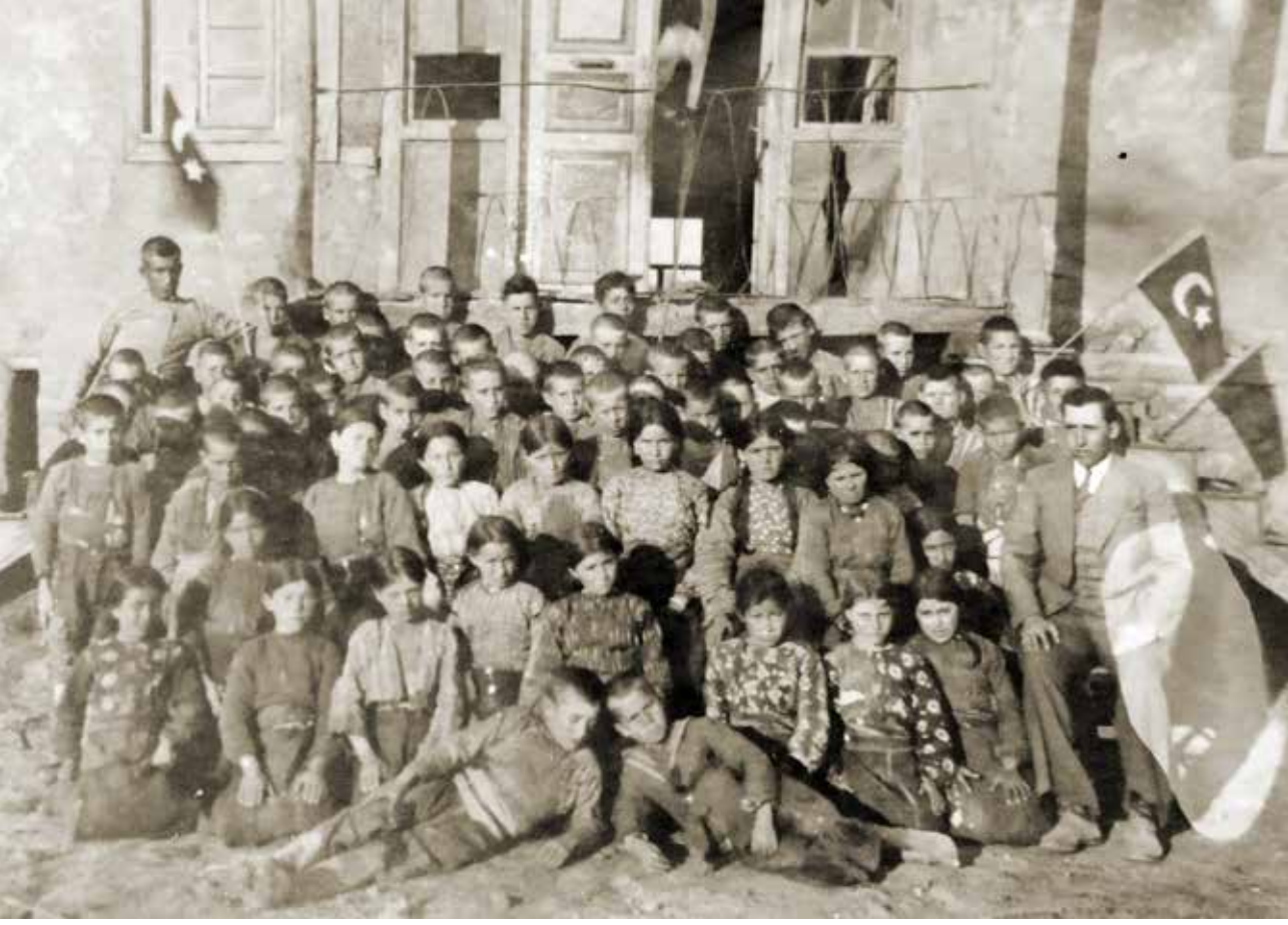
1934 Doğanhisar Bayköy İlkokulu.

8 Temmuz 1939'da Ankara Posta Memurluğu asaleti gelmiştir.