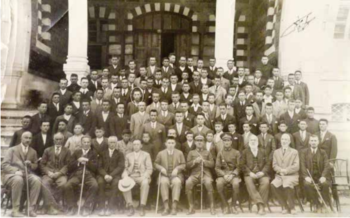
1928 yılı, Kütahya İmam Hatip Mektebi.