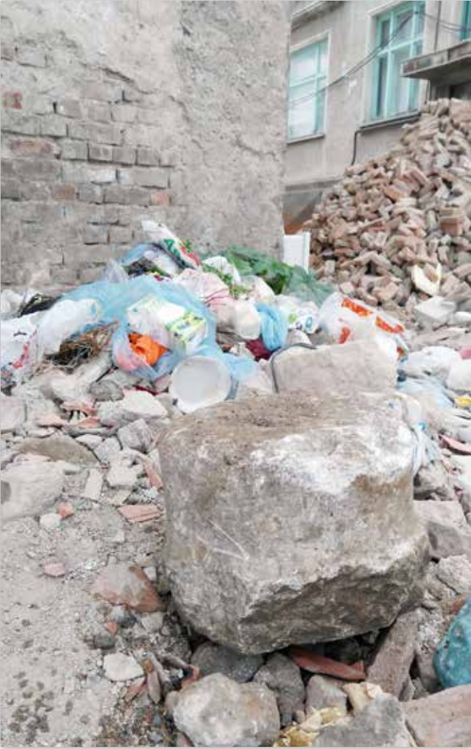
Şükran Mahallesi'nde yıkıntıların arasında tarihi bir sütun parçası. Bu ve bunun gibi daha bir çok mimari parça hafriyat malzemesi zannedilerek toplandı.

ran Mahallesi'nde ortaya çıkan bir tarihî eserin korumaya alındığı duyuruldu. Fakat gördük ki koruma dedikleri şey muazzam bir kemerin ve horasan harçlı kubbe taşlarının bulunduğu bu yapının içinin molozla doldurulması. Belki yüzlerce yıldır yer altında sessiz, sakin, tek parça halinde bekleyen bu yapı, koruma(!) altına alınmak suretiyle yok olma tehlikesiyle karşı karşıya kaldı.