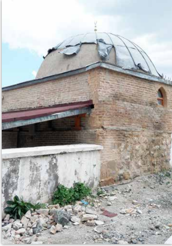
Erdemşah Mescidi'nin son günlerdeki hali.

Mesela Hasbey Dar'ül Huffazi'nin 600 yıllık taşlarına birileri ismini yazıyor ve aylardır bu duruma tek bir müdahalede bulunulmuyor? Gönül ister ki o yazıyı yazan tespit edilsin, hem işlediği bu suçtan ötürü cezalandırılsın hem de o yazıyı ken-