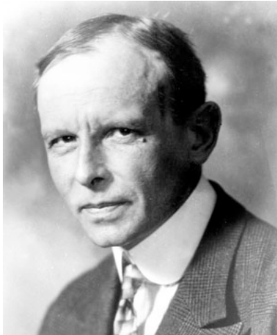
Karl von Terzaghi (1883-1963)

Koca Sinan ise bu hesapları, Terzaghi'den yaklaşık 400 yıl önce ustalık eserim dediği Selimiye Camii'nde kullanmıştır. Malzemeleri alana yayması ve inşaatı durdurması kısa süreli yerleşmeyi beklemek içindir. İnşaatın uzun sürmesinin -ki bunun yapıma ara verilmesinden kaynaklandığı düşünülmektedir- sebebi ise zemin oturmasının tamamlanması içindir. Bu söylenenler rivayet de olsalar gerçek de olsalar değişmeyecek tek bir şey vardır. O da Selimiye'nin hala dim dik ayakta durup, Edirne'ye gidip onu görme k isteyenleri ilk görüşte kendisine âşık etmesidir.