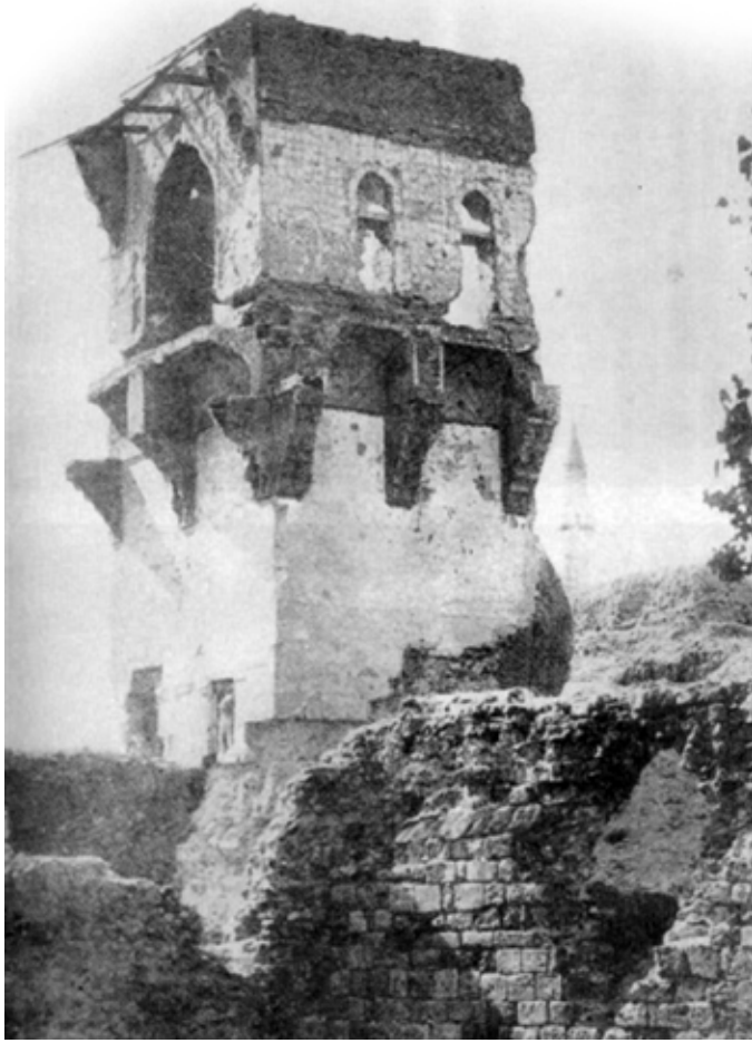
II. Kılıçarslan Köşkü