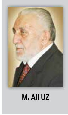
M. Ali UZ

Tarihi eser tahribatı Osmanlı Dönemi'nde başlamış. Bazı Konya valileri ve belediye başkanları tarihi eser tahribatında adeta birbirleriyle yarışmışlar. Dünya-