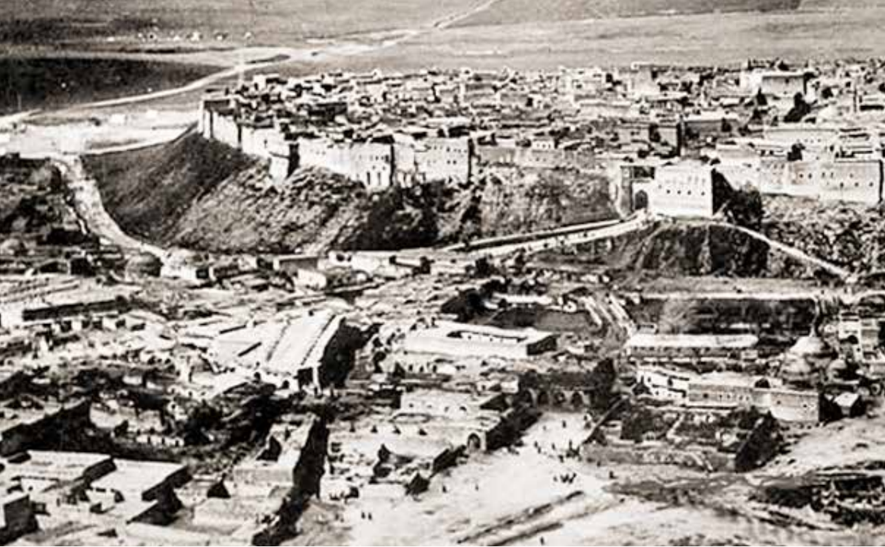
Eski Erbil'den bir görüntü.