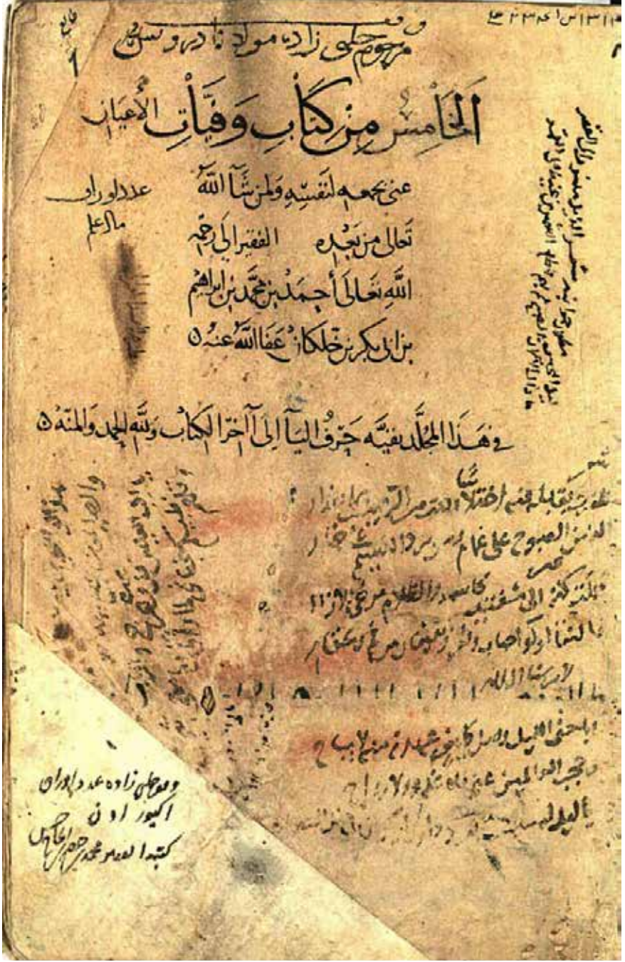
Vefeyatü'l-A'yan ve Enbau Ebnai'z-Zeman, İbn Hallikan, 673 h., İstanbul Fatih Kütüphanesi, Mikروفilm Arşivi No: 1153.

dan pek çok şey öğrendi (5) . Arkasından Harran üzerinden Halep'e geçip baba dostu Bahâeddin