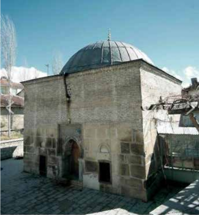
Şekerfuruş Mahalle Mescidi.