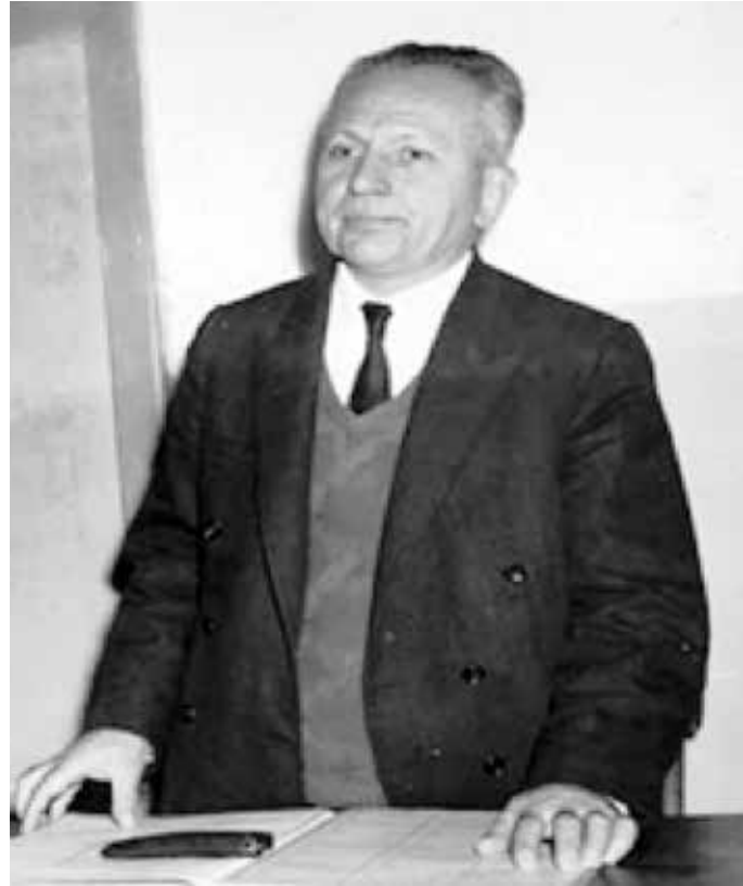
Büyük eğitimci ve fikir adamı Nurettin Topçu.

Günümüze dönüp, ilkökuller kitaplarını incelediğimizde ise