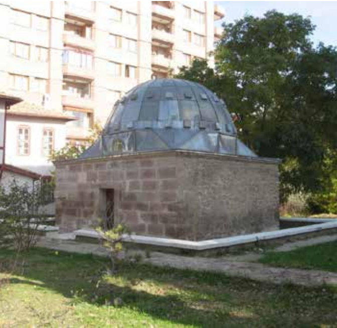
Halka Begüş Türbesi

Konya'da daha pek çok tespiti gereken husus olduğunu söylemeye gerek yoktur.