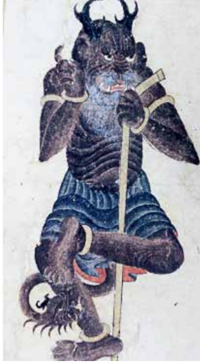
Mehmed Siyah Kalem, Demon, TSM, Hazine, 2153, 48a.*

O taş ev onun sahnesiydi adeta. Bizi pencere kenarındaki yer yataklarımıza yatırır. Bazen yalnız bazen halamın oğulları ile dinleyici olurum. Kendisi dingin ocağın yanına oturur ve sahne onun için hazır olurdu. Hiç sıkıl-