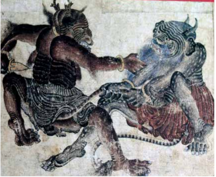
Mehmed Siyah Kalem, Demonlar, TSM, Hazine, 2153, 64b.