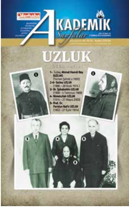
UzluK Özel Sayısı, Akademik Sayfalar, 3 Temmuz 2013, C. 13, S. 23

İlgilendiren en ince yaşantılarının izlerini buluyoruz.