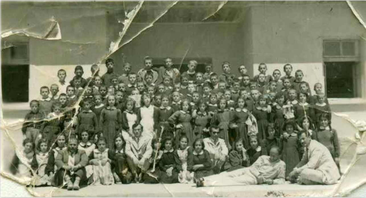
Amcabey'in fotoğraf albümünden bir okul fotoğrafı

Yeni eğitim yılı milletimize hayırlı olsun.