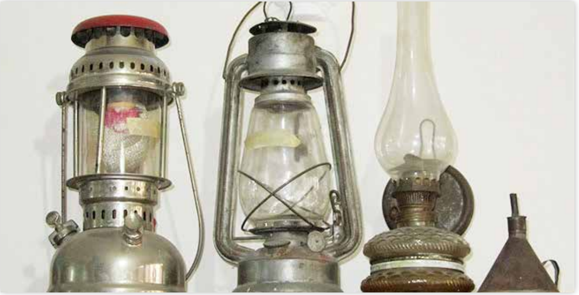
Lüks, lamba, gaz lambası ve idare.

“serhat hudut” olanlara nöbet bekleyenlere dua ederdi.