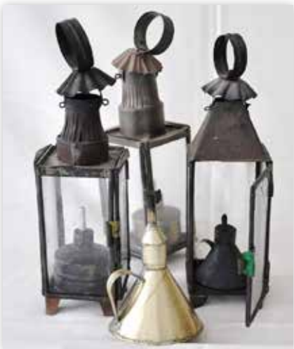
İdare ve fener.

İnsanlar yazacaklar, çiçekler, geçmişten ve gelecekte bir şeyler bulup, okumaya çalışacaklar ve bu böyle olup gidecek.