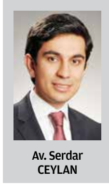
Av. Serdar CEYLAN

• Erdoğan, • Gürsu (Kazak Köyü), • Konarı, • Köklüce (Mamurat'ül Hamid-Kaha), • Kundullu, • Mevlütlü, • Pazarkaya, • Subatan (Mesudiye),