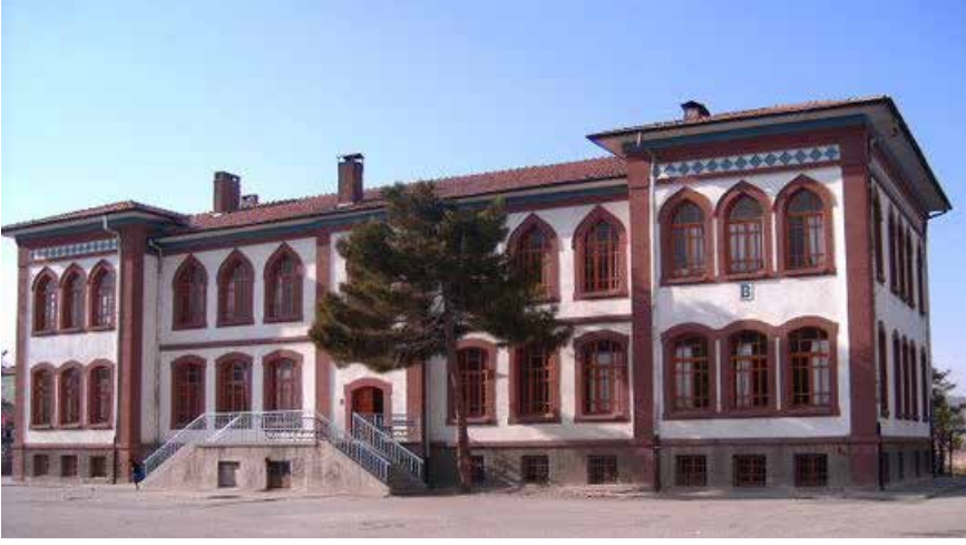
Konya Hakimiyet-i Milliye İlkokulu.

nı söylerlerdi. Bir ortalı defterin kapağının içinde 16 sayfadan oluşan, basım dilinde fasikül ve forma olarak kabul edilen sayfalar bulunurdu. İki ortalı, üç ortalı defterler de, tahmin edileceği üzere 32 ve 48 sayfadan oluşurlardı. Ana baba gününe dönen okulların açıldığı dönemlerde sayısı artırılan satıcılar zaman zaman pazarlama usulüne renk katarlardı: