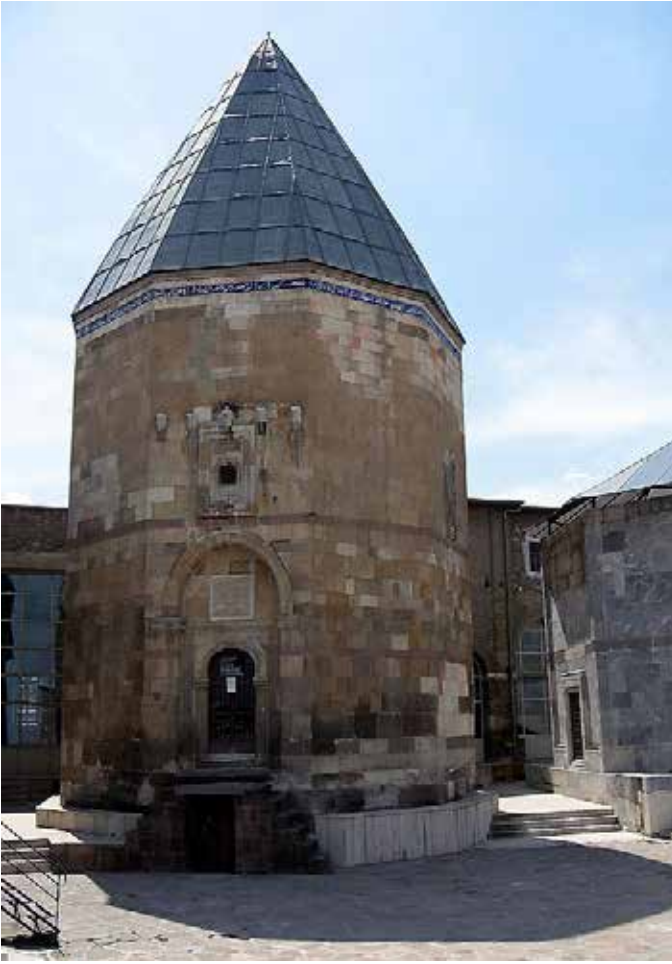
Sultan I. Mesud, II. Kılınçaslan, Rükneddin Süleyman II, I. Gıyaseddin Keyhüsrev, I. Alaeddin Keykubat, II. Gıyaseddin Keyhüsrev, IV. Kılınçaslan, III. Gıyaseddin Keyhüsrev'in medfun bulunduğu, Konya Alaaddin Tepesi'ndeki Sultanlar Türbesi.

nı, onları hizmetine alacağını duyurur. Böyle bir iddiada bulunanların olaya delil olacak köle, elbise, silah ve saire ellerinde ne varsa getirmelerini bunların mukabilinin kendilerine kat kat verileceğini söyler. Bunun üzerine Sultan, ellerinde delilleriyle gelen Lâdiklileri güler yüzle karşılayıp vaatlerde bulunarak onların her birisini şehir ayan ve eşrafından birisine emanet eder. Onların işlerine ferağatı hatırla bakılacaktır.