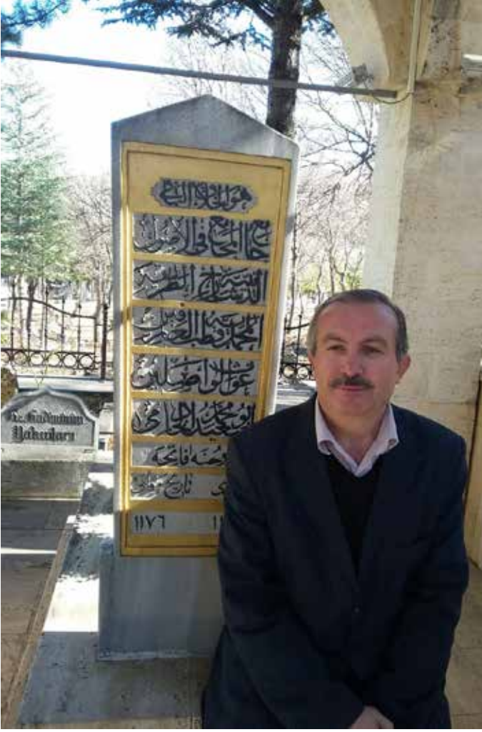
Ebu Said Muhammed el Hadimi'nin kabri, Hadim.

peygamberler şehri olarak tanıtılmasına sebep olacak bir çalışmadır. Bu çalışma belediye ve kültür hizmetleri tarafından yerinde bir tanıtımla kamuyla paylaşılır, ülkemiz ve hatta dünya ölçeğinde reklamı yapılırsa Konya'mızın bir başka açıdan İslam Başkenti hüviyeti kazanacağını göreceğizdir.