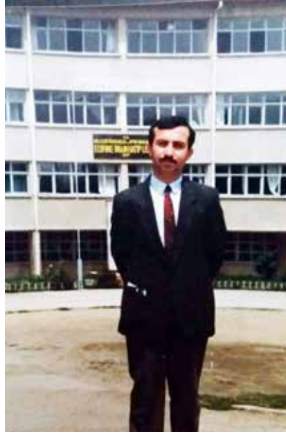
Edirne İmam Hatip Lisesi

71. İl Milli Eğitim Müdürlüğü Arşivinden Mektep Fotoğrafları, 22