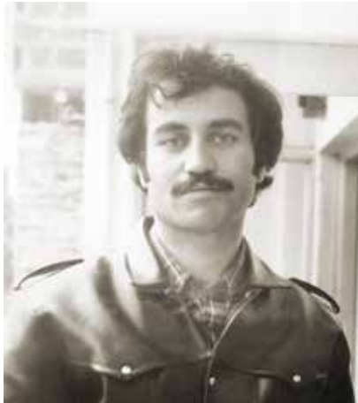
(1) Murat Güçlü, "Konya Aydınlar Ocağı" Konya Ansiklopedisi, C. 6, s. 11, 12.

Eşimin vefatından sonra benimle daha çok ilgilenmeye başladı. Sık sık telefonla arar, halimi hatırlar sorar ve sağlığımla yakından ilgilenirdi. Yeri geldiğinde meslektaşlarından benim için randevu alır, ara-