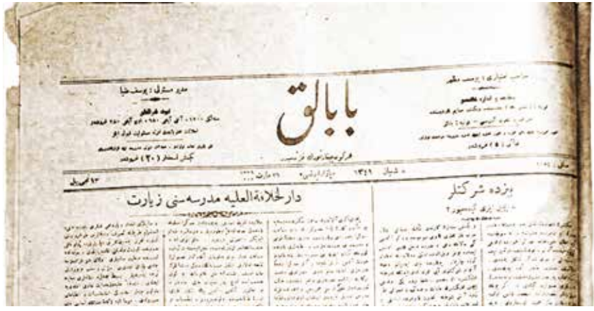
26 Mart 1923 tarihli Babalık gazetesi.