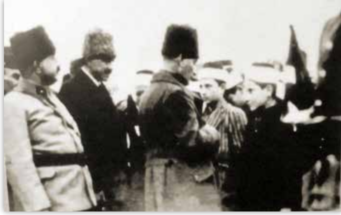
22 Mart 1923'de Atatürk'ün Konya ziyareti.

İstanbul'dan mezun olduktan sonra 18 Mart 1914'de (15) Konya Da-