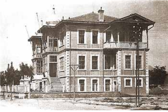
Kız Orta Okulu: Maruni Yusuf Şar'ın 1910 yılında yaptırdığı, 1910-14 yılları arasında Fransız Konsolosluğu, 1914-23 yılları arasında Askeri Hastane, 1924-41 yılları arasında Ordu Müfettişliği, 1941-47 yılları arasında Kolordu Komutanlığı, 1947'den sonra Kız Lisesi, daha sonra da Kız Orta Okulu ve günümüzde Olgunlaşma Enstitüsü olarak kullanılan tarihi bina.