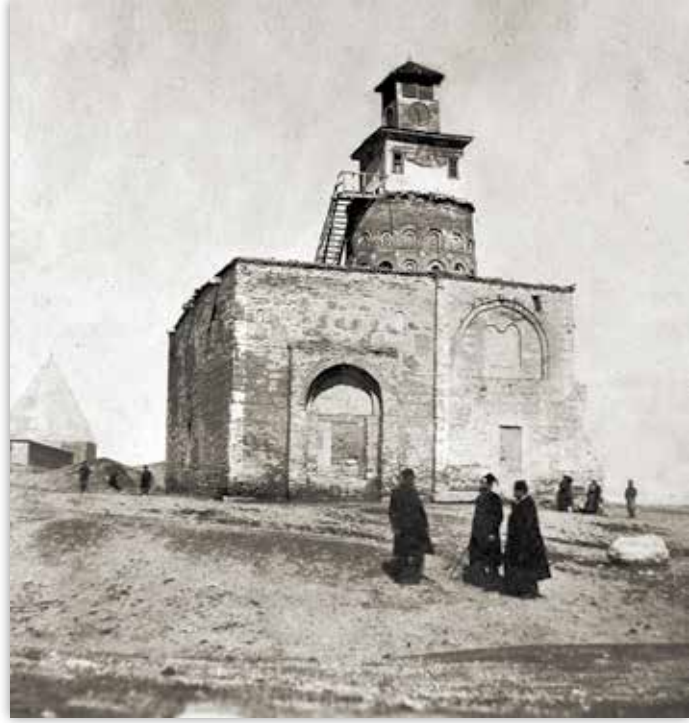
Alaeddin Tepesi'ndeki yıktırılan Eflatun Mescidi ve saat kulesi.

29 Ekim 1923'de atılan top sesleriyle memleketin her yanına Türkiye Cumhuriyeti hükümetinin kurulduğu ilan edilmiş, Müşir Gazi Mustafa Kemal Paşa cumhur başkanlığına seçil-