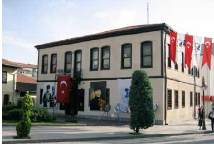
Günümüzde Akşehir Batı Cephesi Karargahı Müzesi olan, 1904 yılında inşaa edilen Akşehir Belediye Dairesi.

di ile karşılaştım. Bana kapalı bir mektup verdi ve bunu Konya'da bilmem hangi medresede, falan efendiyeye vermemi söyledi. Zarfın üzerinde adres yazılıydı. Mektubu cebime koydum ve kompartımana girdim.