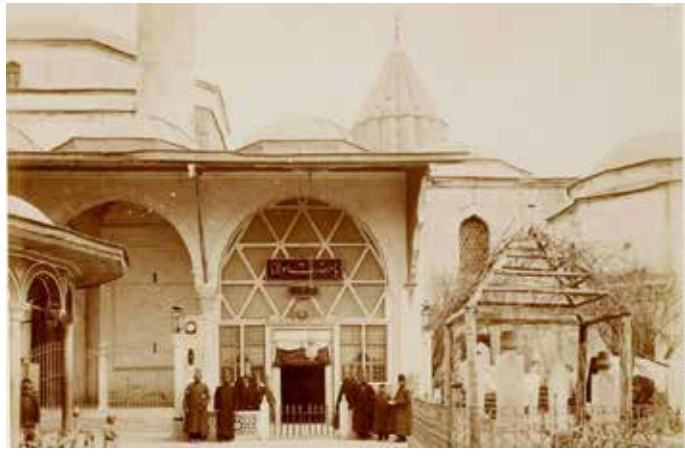
Osmanlı devrinde Mevlana Dergahı.

Türk Ordusu daha teçhizatını tamamlayamamış, azgın düşman kuv-