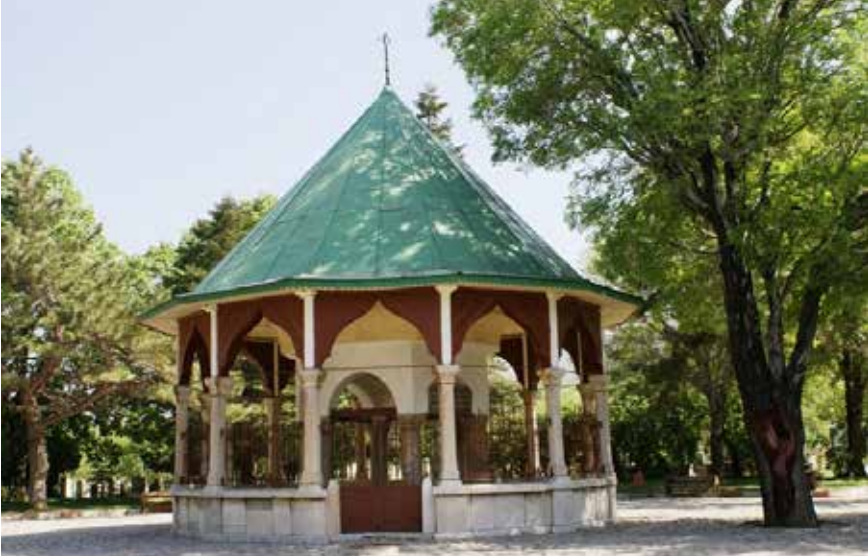
Günümüzde Nasreddin Hoca Türbesi