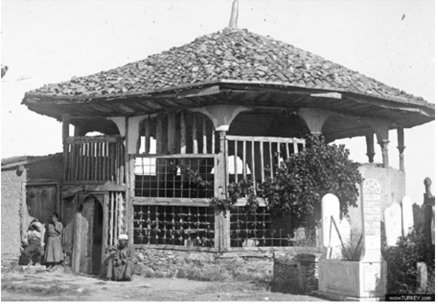
19. yüzyılın son çeyreğinde Nasreddin Hoca Türbesi

Türbedar: ( Seslenir ) Ağa sadakanızı veriniz de güle güle gidiniz!