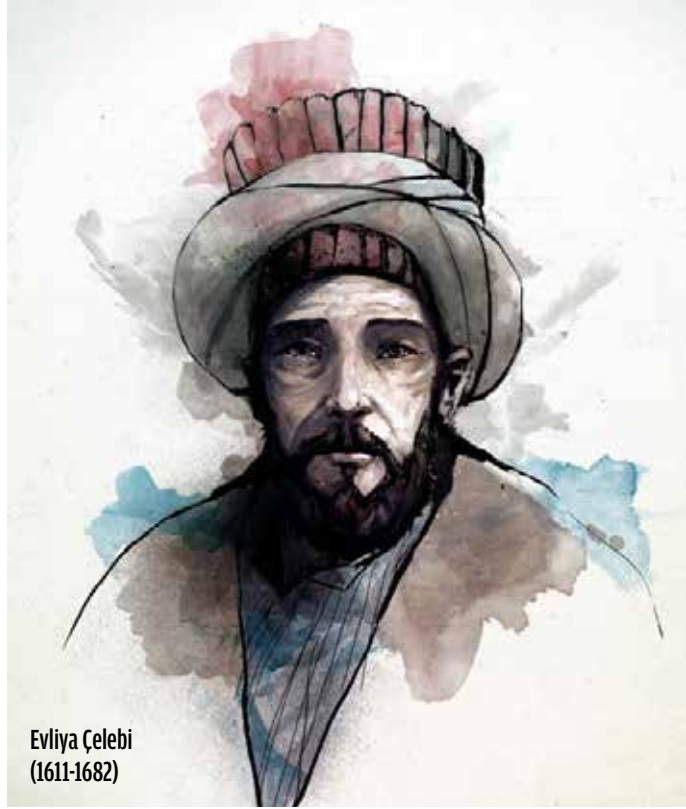
Evliya Çelebi (1611-1682)

Evliya Çelebi: Demek bilirsin, kaç tane bilirsin? Bir gün Timur Hacı ile hamama gidip bir futa ile gusledilerken esna-yı kelimada Timur: "Hoca Efendi ben ki cihangir bir padişah-ı zi-şanımlı; satılmaklığım lazım gelirse beni kaç alırsın?" der. Hacı: "Kırk akçeye anca alırdım." cevabında bulunur. Timur: "Behey Hocam! Benim futam kırk akçe eder." Hoca: "Ya bende kırk akçeye futayı alıyorum, yoksa senin gibi bir Moğol parçasını ne yapacağım? Bir mangır bile etmezsin!" dedikte hazır cevaplı-