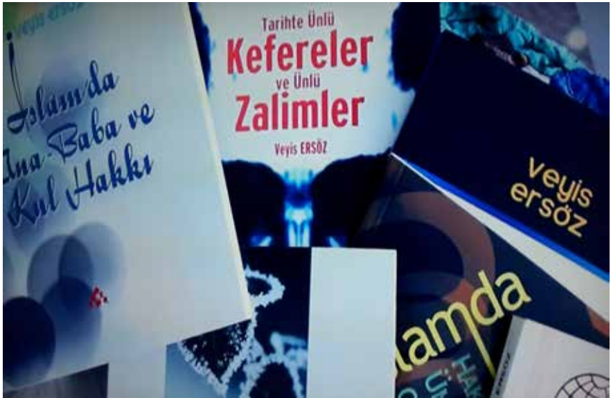
Veyis Ersöz'ün neşredilen eserlerinden bazıları.

Yazarlık hayatına üç kıtalık ' Toprak ' isimli şiiri ile başlamıştır. Bahse konu şiiri İstanbul'da on beş günde bir çıkan İlk Öğre-