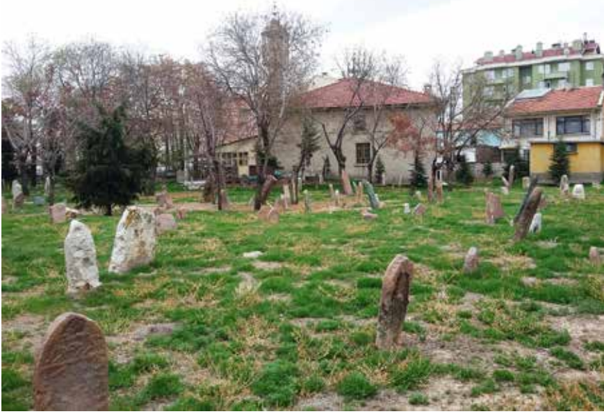
Üç peygamberin metfun olduğu rivayet edilen Sarı Yakup Mezarlığı.

da, bugün park ve otobüs terminali haline getirilen kabristanda olduğunu ifade etmektedir.