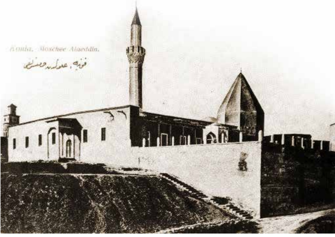
Üç peygamberin metfun olduğu rivayet edilen Alaaddin Camii ve kuzey avlusundaki haziresi.