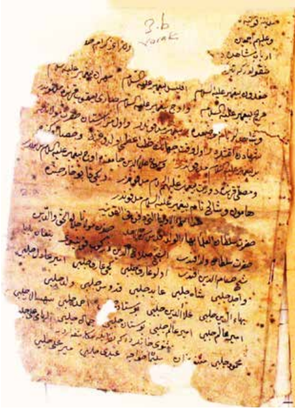
Koyunoğlu Nüshası (1) 10154 numaralı “Mecmua Konya’da Medfun Evliya ve Enbiya Medfenleri”

“Medine-i Konya...ve aleyhim ecmain.... eizze-i kirâm ha... menkuldür ki teberruken.... Cağdun peygamber aleyhisselam, İklîs peygamber aleyhisselam, Mihrân peygamber aleyhisselam, Merîh peygamber aleyhisselam ve üç peygamber aleyhisselam Sarı Yakub kurbünde medfundur. Ve Şâhidler nâm mevzi’de bir peygamber medfundur. Ve ol mezâristân Hazreti Mevlâ nâmına şahadet etmişlerdir ol vakit cihânın kutbu azamı olduğuna ve Hisarönü’nde bir peygamber aleyhisselam medfundur. Ve Sultân Alaeddin Camii’nde üç peygamber aleyhisselam medfundur. Ve Musalla kurbünde dört peygamber