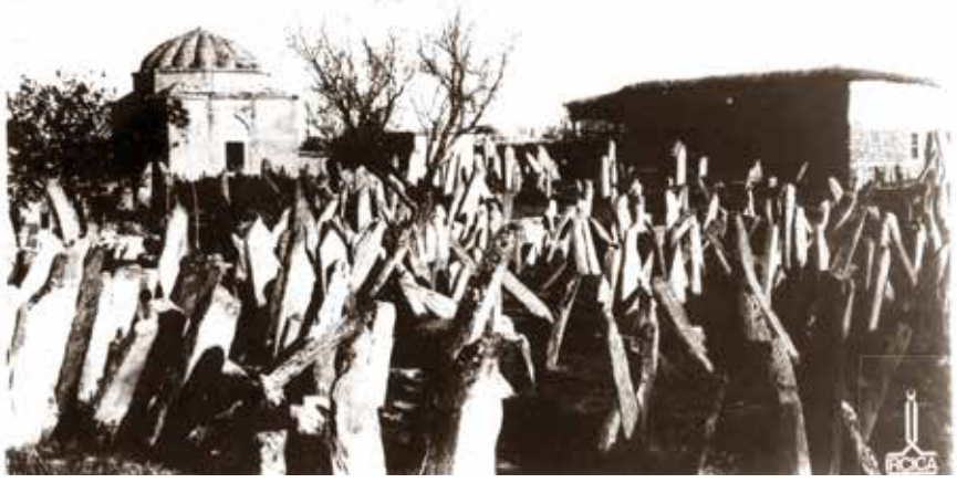
Cağdun, İklis, Mihran, Merih Peygamberler (as) isimli dört peygamberin metfun olduğu rivayet edilen Musalla Mezarlığı'nın 19. yüzyılın son çeyreğindeki fotoğrafı.

“Mukâşefe ve müşahede erbabı” hakkında (TDV) İslam Ansiklopedisi'nde şunlar kayıtlıdır: “(Bunlar) sufiler, mutasavvıflar demektir.