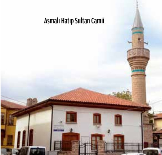
Asmalı Hatıp Sultan Camii