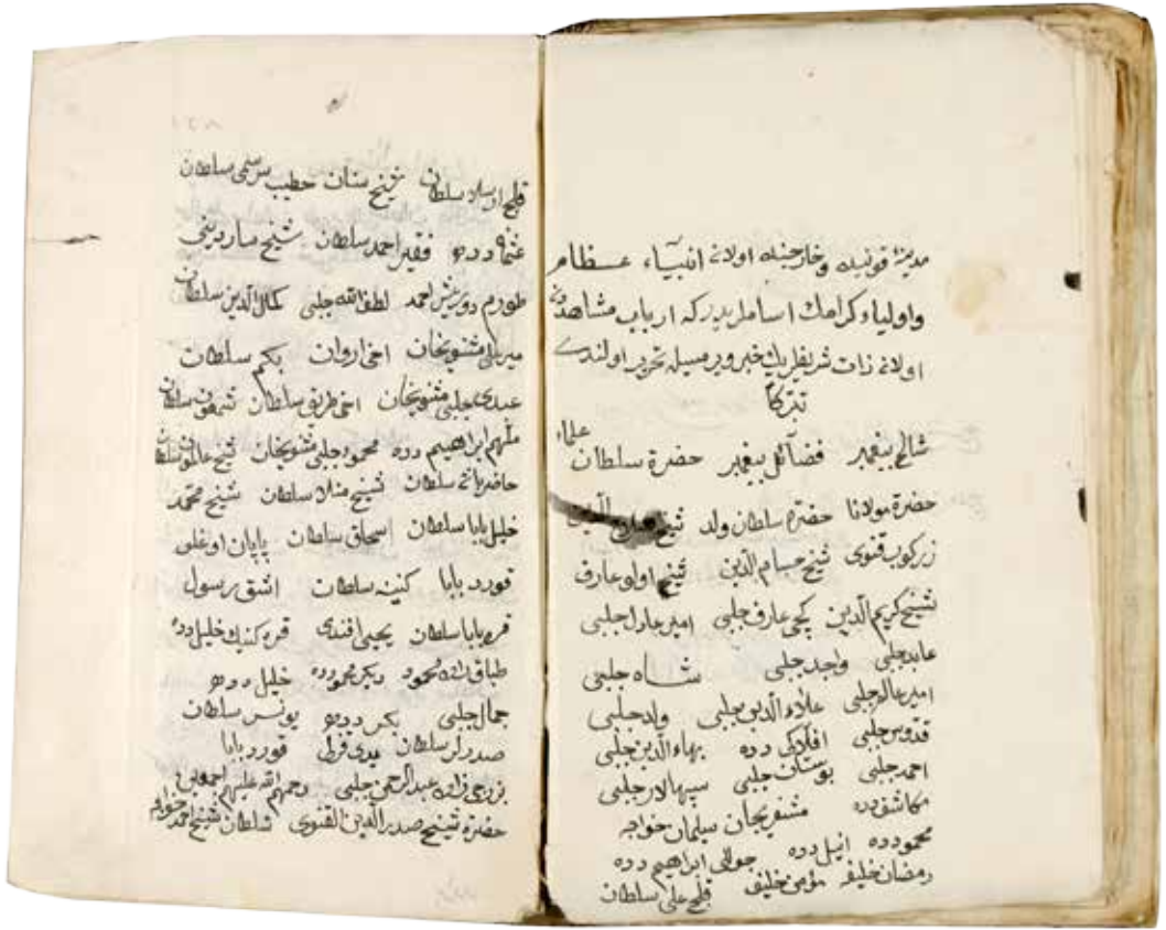
Milli Kütüphane Nüshası.