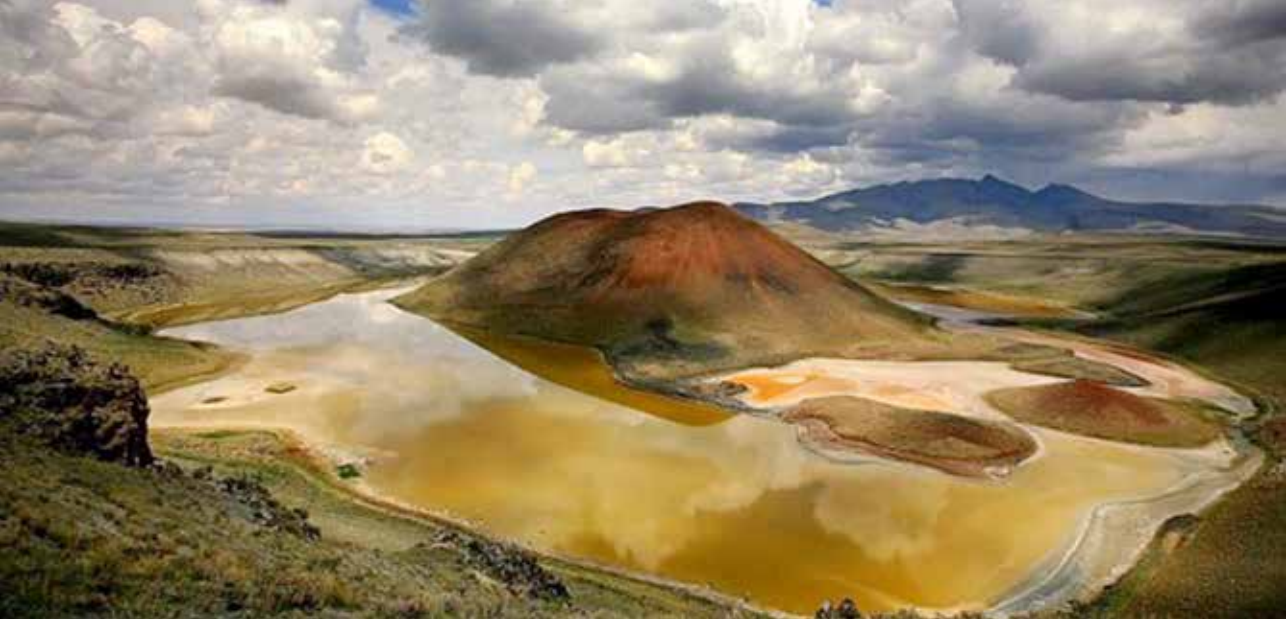
Meke Gölü, Karapınar Konya, Foto: Ahmet Kuş.

Osmancık Dağı ve Meke Dağı vardır. Göllerimiz ise; Meyil Obruk Gölü, Çıralı Obruk Gölü, krater gölü olan Acı Göl ve Meke Gölü'dür. Meke Gölü çift patlamayla meydana gelen bir göl olup Dünya'nın nazar boncuğu diye anılmaktadır.