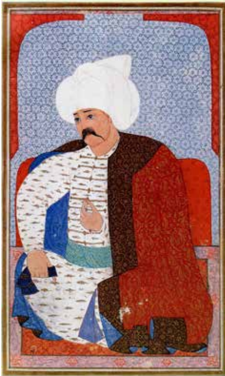
Yavuz Sultan Selim (1470 - 1520)

Vakıf kurumlarında çalışan görevliler görevinden feragat eder, azledilir veya ölürse yerine başka birisi tayin edilir. Padişah değişikliklerinde atama beratları yenilenir ve bu yenilikler Hurufat Defterleri'nin kenarlarına özet olarak kaydedilir. Hurufat Defterleri'nde kazaya ait bütün vakıf eserleri, bunların banileri ile tamir ettirenleri, nelerin tamir veya ilave edildiği, atama ve vakıf problemleri kayıt altına alınmıştır.