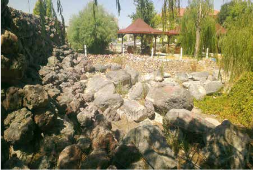
Karapınar'ın adına kaynaklık eden pınarın çıktığı mevki.