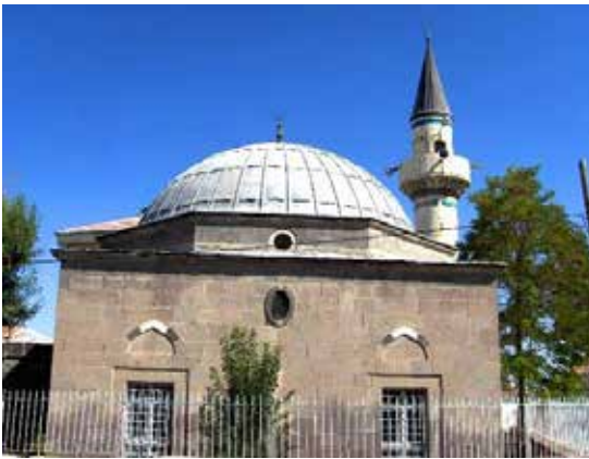
Karapınar Reşadiye Camii.

Çıralı obruğu ve meyil obruğu görülmeye değer, canlı obruklardır. Bunların dışında Akviran obruğu, Kızıl obruk, Aren obruğu, çoban şamil obruğu, Dikmen obruğu, Güvercinli obruğu, Ganggalı obruğu, Putur obruğu, Sekizli obruğu, Yavşan obruğu, İnoba obruğu, Zincanlı obruğu ve Konya – Adana yoluna 200 metre uzakta Yarımoglu obruğu. Buralar bilhassa coğrafyacı ve jeologlar tarafından görünmeye ve incelenmeye değer yerlerdir.