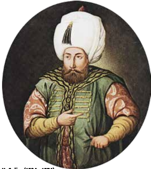
II. Selim (1524 - 1574)

taniye adıyla yeniden inşa edilmeye başlanmıştır. Kanuni Sultan Süleyman, külliye inşaatı devam ederken Konya havzasında pek çok köy, mezra ve yaylağı külliye vakfettik üzere oğluna vermiştir. Karapınar'a 120 hanenin iskan edilmesine dair 20 Nisan 1560 tarihinde bir