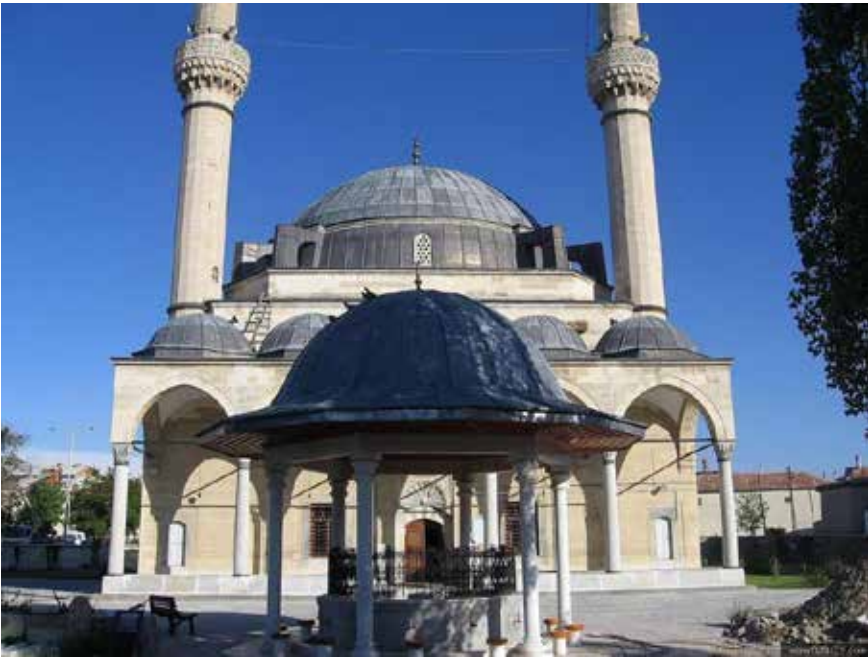
Sultan Selim Cami, Karapınar - Konya.