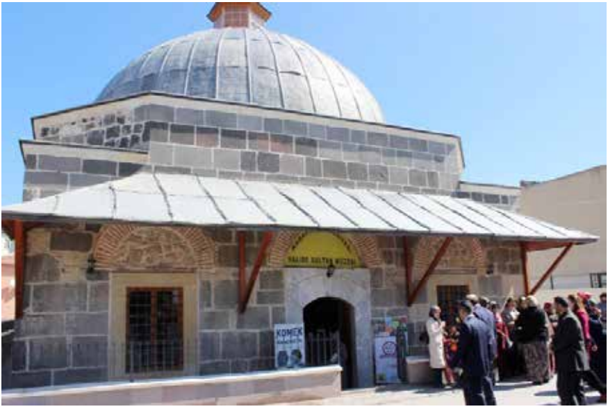
Hürrem Sultan Hamamı

“ Obruk ” oyuk, çukur, çökmüş yer anlamındadır. Obruklar birer tabiat harikasıdır. Karapınar’da şuana kadar 43 obruk oluşmuş, yenileri de her an oluşabilir. Karstik kökenlidirler.