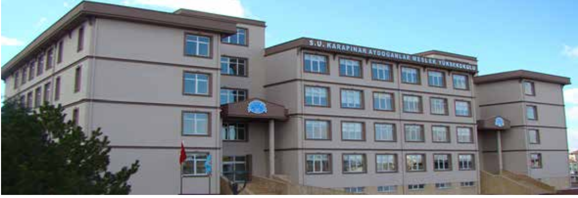
Selçuk Üniversitesi Aydoğanlar Meslek Yüksek Okulu.

Yavuz Sultan Selim'in bu tedbirlerinden sonra Derbent Köyü kurulmuş ve halk toplanmaya başlamış Sultan Selim Camii'nin temelleri 49 yıl bekledikten sonra II. Selim ( Sarı Selim ) Konya valisi iken 1563 yılında büyük bir külliye ve bir şehirde bulunması gereken her şeyi ile birlikte tam bir Osmanlı şehri gibi kurulmuş gelip yerleşenlere bazı muafiyetler tanınmıştır. Eskiil kazasına bağlı bir kasaba olmuştur. Adına da sultan şehri anlamına gelen "Sultaniye" denilmiştir.