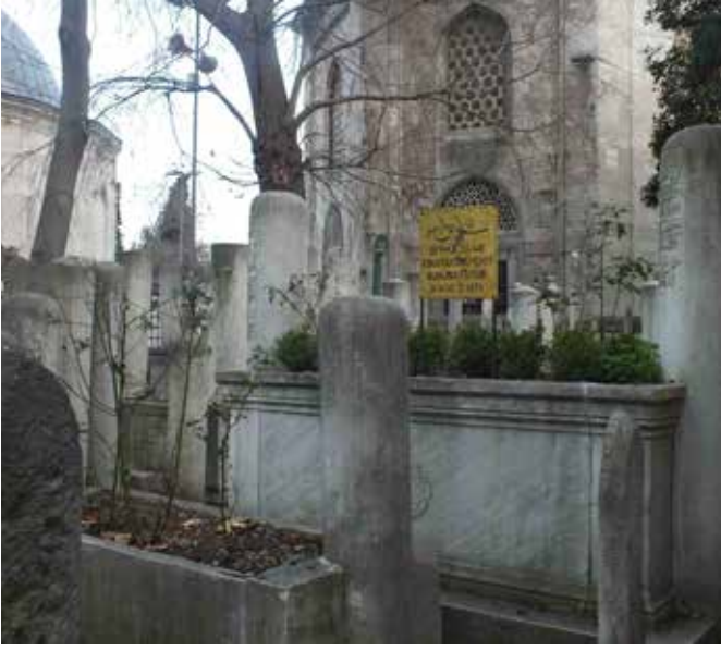
Istanbul Eyüpsultan'da metfun olan Şeyhülislam Mehmed Ebussuud Efendi (1490 - 1575).