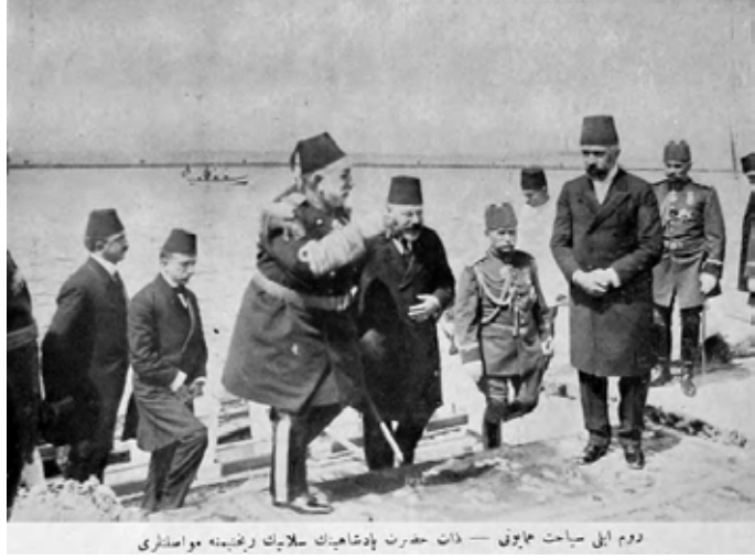
دوم ایل سیاحت مایونی — ذات حضرت پادشاهیک سلانیک دغندمه مواسانداری

İlk merasim Dolmabahçe sarayında yapılacaktır. Padişahın Selanik limanına ulaşması için İstanbul’dan çıkış zamanı ona göre ayarlanacaktır. Selanik vilayeti askeri ve sivil yöneticilerinden ve vilayetçe seçilecek önde gelenlerden bir heyet, padişahın Selanik’te karşılanması için bulundurulacak padişahın gemisini karşılamak için Karaburun mevkiinde yerini alacaktır. Padişahın gemisi Büyük Karaburun’dan geçerken yirmi bir pare top atışıyla padişaha selam ve hürmet gösterilecektir. Padişahın gemisinin Selanik Limanı’na gelişinde Beyaz Kale, Küçük Karaburun ve Beşçınar mevkile-