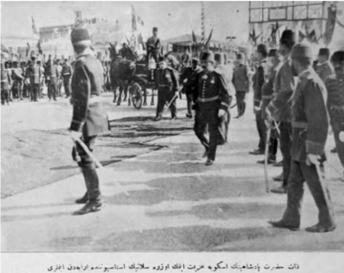
Zat-ı Hazret-i Padişahının Üsküb'e azimet etmek üzere Selanik İstasyonu'nda arabadan inmeleri, Mayıs 1327.

Üç haftalık gezinin (5 Haziran 1911 - 27 Haziran 1911) en önemli durağı Kosova idi. Sultan I. Murad'ın (1326-1389) türbesini ziyaret eden Sultan Reşad, Kosova