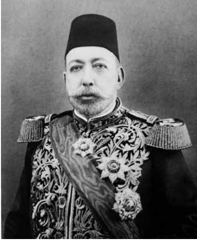
Sultan V. Mehmed Reşad (1844-1918)

dur. Eminiz ki Arnavut kardeşlerimiz İslam halifesinin mübarek yüzünü görünce her şeyi unutacaklar ve kalplerinin hükümete olan bağlılığı artacaktır. Padişahın Rumeli seyahati diğer Balkan devletlerinin kalplerine de korku düşüreceklerdir. (3)