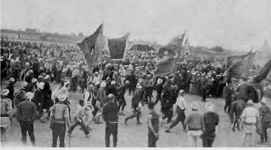
خليقة اسلام ايله برابر اداي صلات ايتك اوزره فوج، فوج شهيد مبارکه کلان ارن اوود قارداش لر مزدن برقي