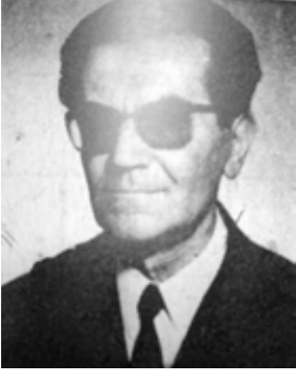
Namık Ayas (1909-2001)