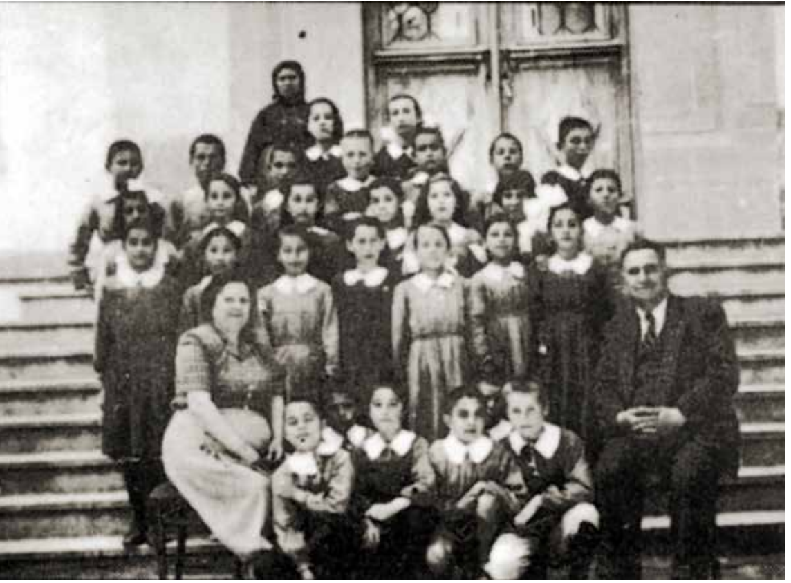
Hâkimiyeti Milliye İlkokulu... 5 A sınıfından bir görüntü.