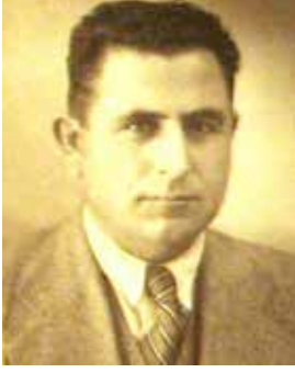
Bahattin Gönenç (1893-?)