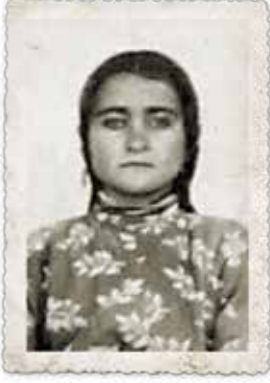
Şehri Keçeci Eke (1936)