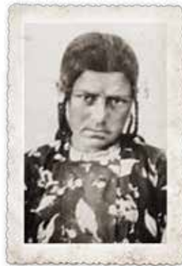
Pamuk Özen Sarı (1935)