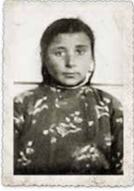
Sultan Mert (1938)