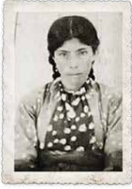
Asiye Polat Yiğit (1935)