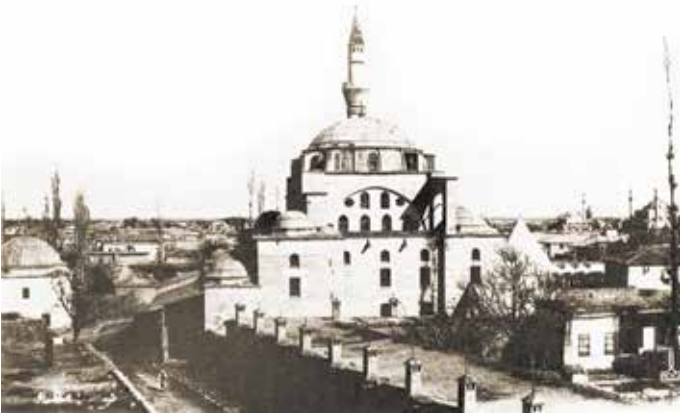
Şerafettin Camii ve ön planda Ziyaiye Medresesi.