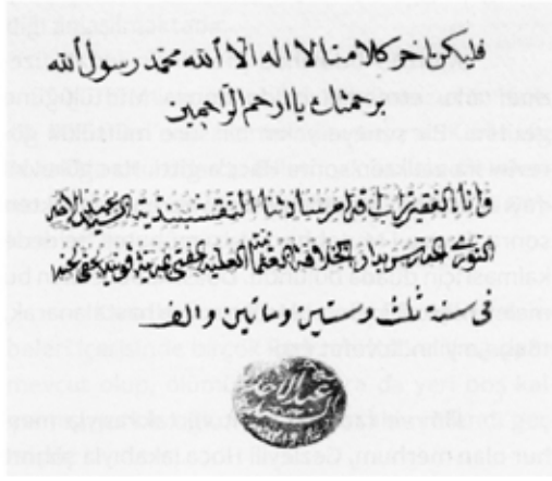
Müftü Abdülehad Efendi'nin verdiği bir icazetin son sayfası.