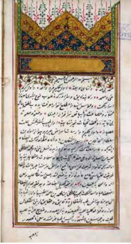
Risâle-i Fezziyye Fi'l-Lug'ati-l-Müfredâti-t-Tıbbiyye (BYE Süif 163)

rı, baş, ağız, diş, yüz, burun kulak, cilt ve ayakta görülen hastalıklar hakkında bilgiler verilmektedir. İç hastalıklardan da bahsedilen eserde; lavman, fitil, yakı, merhem şurup, ishal ve kabız yapıcı ilaçların terkipleri anlatılır. Cinsel yaşam ve hastalıklarına dair bilgilere de yer verilmiştir. Son bölümde kitabın yazılma gerekçesi anlatılmıştır. Sade bir dille kaleme alınan bu eser hekimlerin bulunmadığı ortamlarda halka faydalı olmayı da amaçlamaktadır. Koruyucu hekimlik açısından da önemli olduğu söylenebilir. Bu yazmanın, aynı kütüphanede 2739/3, BY2887-2739/3- 5274/1- 6415/1 numarada kayıtlı başka nüshaları da mevcuttur.