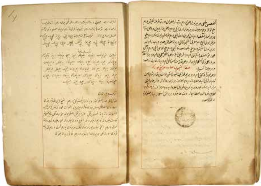
Müfredât-ı İlm-i Eczâ (BYE 4842)