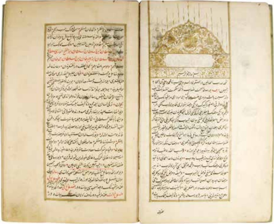
Ves'âil-i Müşfiye li'l-ebrazıl Müşkile (YK 480/1)