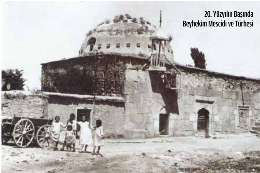
20. Yüzyılın Başında Beyhekim Mescidi ve Türbesi

Bir başka mektubunda ise ondan, devrin hükümdarlarını avucunun içinde tutan ünlü Selçuklu devlet adamı Muînüddin Süleyman Pervâne'ye selâm ve teşekkür