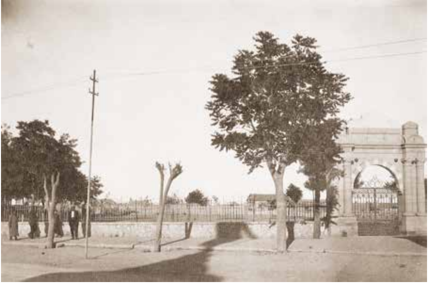
Millet Bahçesi ve günümüzde Konya İmam Hatip Lisesi'ne taşınan tescilli tarihi kapısı.