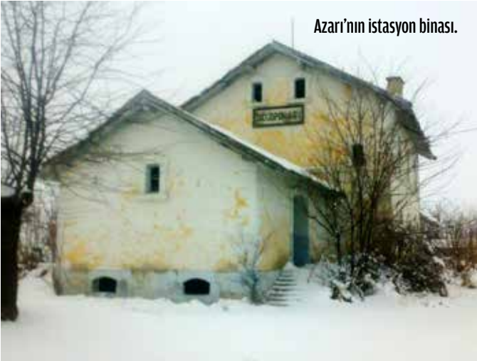
Azari'nın istasyon binası.

Azari Köyü Câmii 'ne ilişkin de bazı arşiv evrakı da tespit edilmiştir. Vakıf mülkiyetinde olan Azari Köyü Câmii'ne yapılan müdahalelere ilişkin olarak; Karahan Beylerbeyi'ne ve Akşehir Kadısı'na hitaben yazılan bir hü-