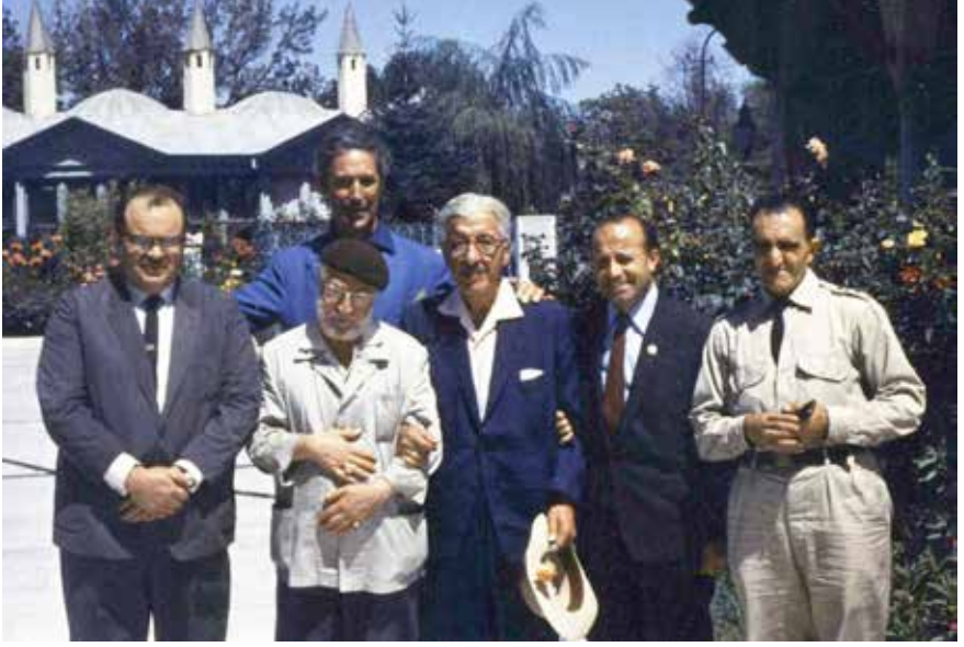
Türbe-i Şerif'te 1965 Konya.