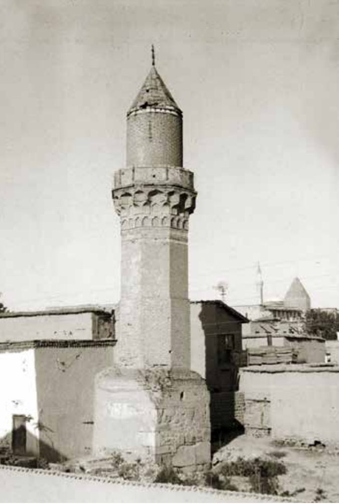
Hatuniye Camii minaresi ve geri planda Alaaddin Camii ve Selçuklu Sultanları Türbesi.

minin burhamı, ulu sultan, Keyhüsrev oğlu Keykubat'ın (saltanatı) günlerinde, yüce Tanrının rahmetine muhtaç, zayıf kulu Hacı Mahmut oğlu Bedreddin Beremoni'dir. Tarihi 627 yılıdır." İbaresini yer almaktadır. Konyalı bu kitabeyi, "Devlet Hatun Bedreddin Biremoni'nin kardeşidir. Babaları da Danişmend oğullarından Muzafer-üd-din Mahmud'dur. Devlet Hatun 627 H/1230 M yılından evvel öldüğü için belki de bir zelzeleden yıkılmış olan mescidi tamir ettirmiş ve üstüne de kendi adını kazdırmıştır." şeklinde yorumlamaktadır. (5)