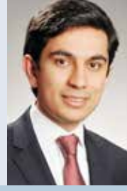
Av. Serdar CEYLAN

A bdullah Fevzi Efendi'nin hatıratında Tuzlukçu'da o dönemde yaşayan bazı kişilerden de bahsedilmektedir. Biz nüfus defterleri (1) , ailelerde muhafaza edilen evrak üzerinde yaptığımız inceleme ve araştırmalar ile bu kişiler ve aileleri hakkında şu hususları tespit ettik.