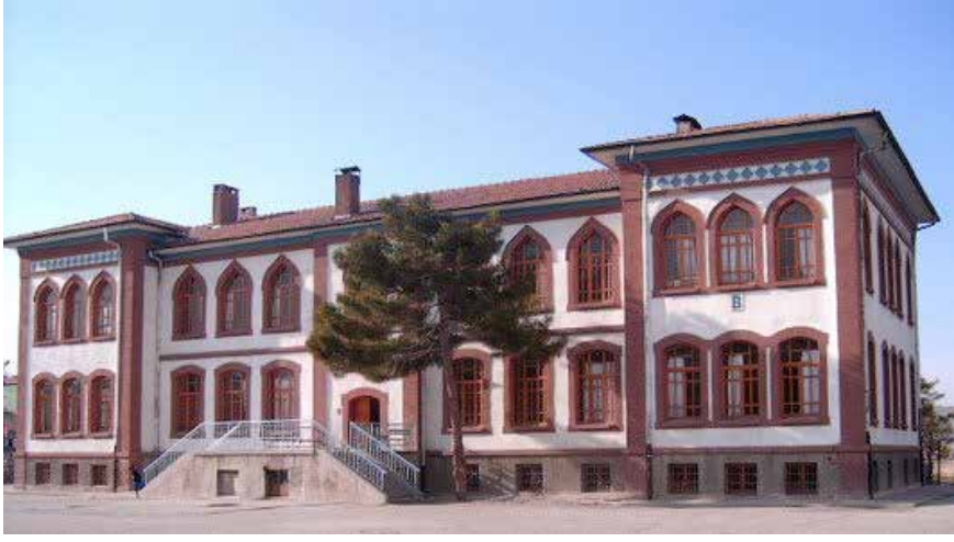
Hâkimiyeti Milliye İlkokulu