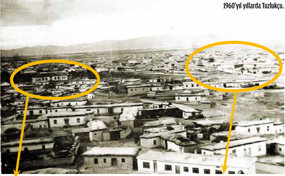
1926 yılında inşa edilen tarihi Tuzlukçu ilkokulu.