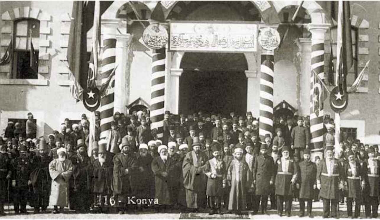
Konya Hükümet Konağı önünde Cülüs merasimi.

gelmeyince Aslanlı Kışla binası Paşa sarayı olarak yaptırılmış, buranın o zamanın şartları içerisinde şehre uzak olmasından dolayı kullanılmamış ve konak askeri kışlaya tahvil edilmiştir. Ahmet Tevfik Paşa'nın (2) (v. 1878) valiliği zamanında 29 Rebiyül-ahir 1284 / 30 Ağustos 1867 tarihinde gerçekleşen çarşı yangınında sarayın büyük bölümü yanmıştır. Bu yangından bazı evraklar kurtarılabilmektedir.