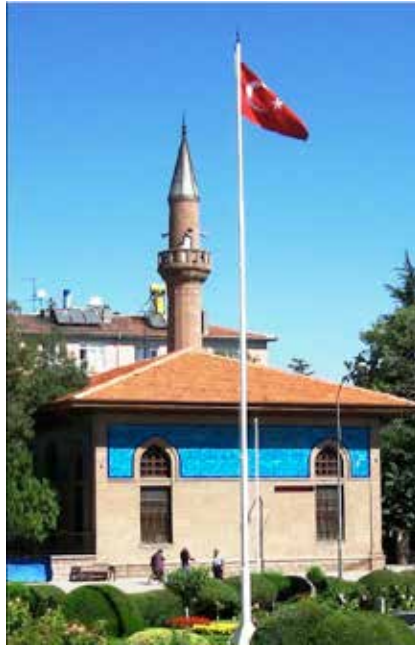
Amber Reis Camii'nin kuzey batı bitişiğindeki Hürremşah Zaviyesi'de günümüze ulaşmamıştır.