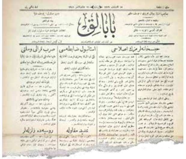
"Hapishanelerimizin İslahı" 15 Kanun-u Evvel 1927, Babalık gazetesini.