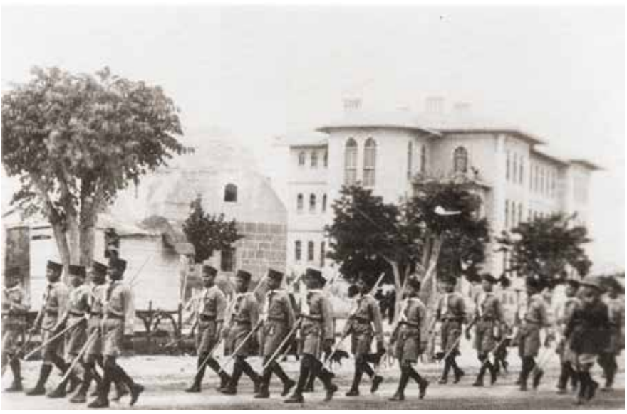
Amber Reis Türbesi ve Konya Lisesi

mii'nin kuzeybatı bitişiğindedir (7) . Yusuf Küçükdağ ise zaviyenin Konevi Külliyesi civarında olduğunu söyler (8) . Tapu kayıtlarından yaptığımız yeni tespite göre Kadı Hürremşah'ın türbesinin yeri Sadrettin-i Konevi Türbesi'nin karşısında küçük kabristandadır. Kadı Hürremşah Darülhadis de türbesinin yanındadır. Acaba zaviye de burada diğer yapılarla birlikte bir külliye şeklinde mi idi bilemiyoruz.