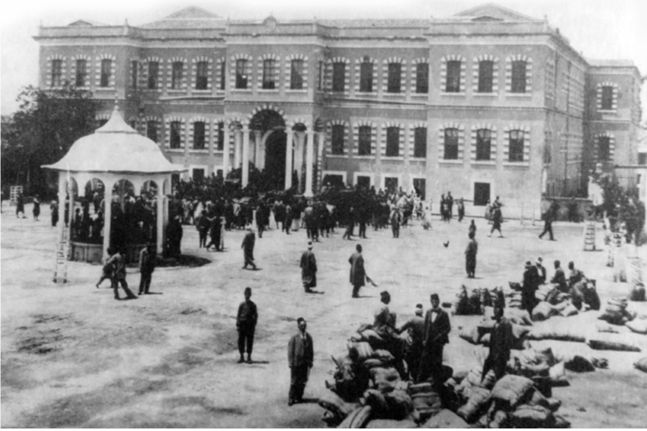
Bedelci Sarayı'nın yerine yapılan Konya Hükümet Konağı.