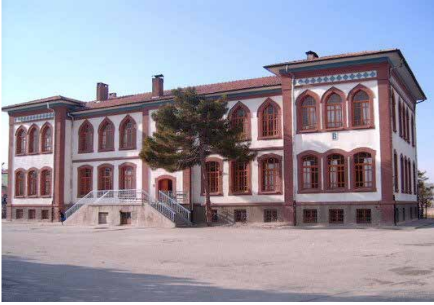
Hakimiyet-i Milliye İlkokulu (23 Nisan İlkokulu)

oraların temizlenmesi, belenmesi, vb. işleri yerine getirilirdi.