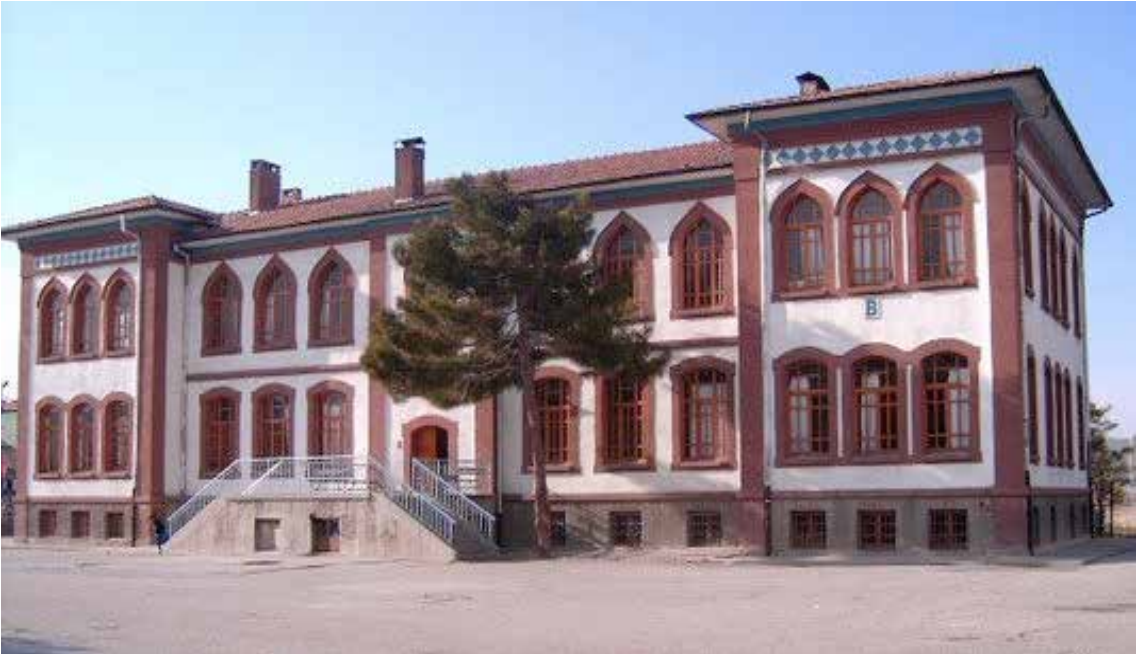
1926 yılında inşa edilen Hâkimiyet-i Milliye İlkokulu.