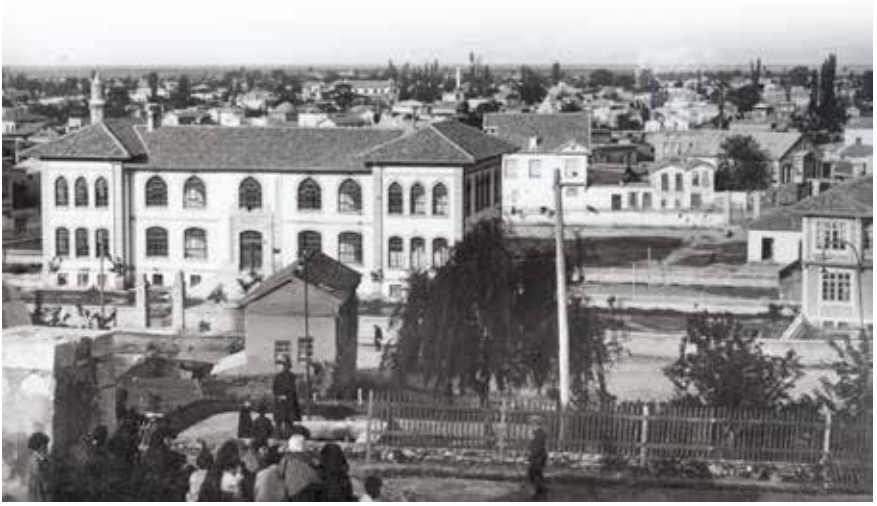
Gazi Mustafa Kemal İlkokulu.

Mart 1998 tarihi itibariyle “ 23 Nisan Egemenlik İlköğretim Okulu ” olmuştur, 2012-2013 Eğitim Öğretim yılında da 4+4+4 zorunlu öğretim uygulama ve planlaması doğrultusunda ortaokul olmuş ve adı da “ 23 Nisan Egemenlik Ortaokulu ” olarak değiştirilmiştir. 03.06.2013 tarihinde de “ 23 Nisan Egemenlik İmam Hatip Ortaokulu ” olmuştur.