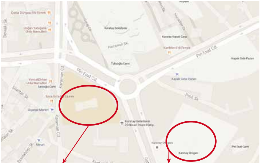
Hakimiyet-i Milliye İlkokulu.

Hatırlatma: Ankara'da, Ulus'tan Kızılay'a doğru giderken, Gençlik Parkı'nın karşısına düşen bir alana Ankaralılar, Hergele Meydanı derlerdi, hâlâ da derler mi, bilmiyorum. Oraların başka adları da vardı. Biz Konyalıları ilgilendiren özelliklerinin ikisi ise şöyledir: Hemen yakınında Meram Oteli vardı (1957), şimdi de var mı? Gençliğimde birkaç sefer kaldığımı hatırlıyorum. Bir de, Konya'mızın köklü ulaşım şirketlerinden Oto Nakliyat 'ın oralar da bir yazıhanesi vardı, oradan binip Konya'ya revan olurduk. Burada, Hayvan Pazarı – Hergele Meydanı ikilisine dikkatinizi çekmek istedim.