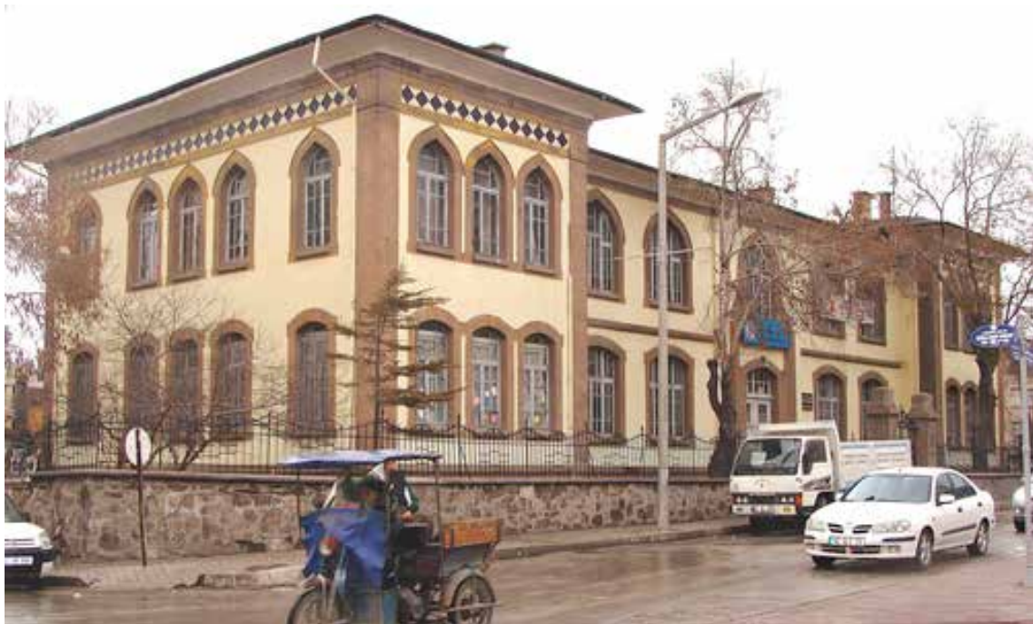
1927 yılında yapılan İsmet Paşa İlkokulu.