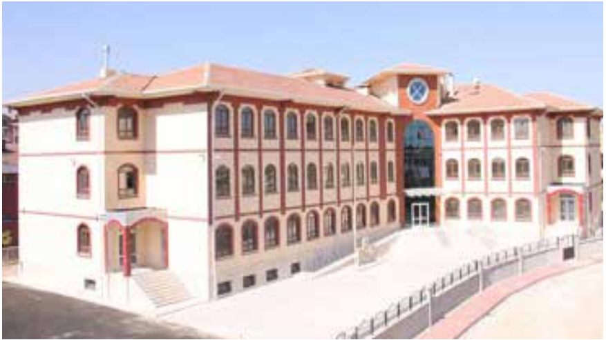
2013 yılında inşa edilen Karatay Belediyesi 23 Nisan Egemenlik İmam Hatip Ortaokulu.

http://mebk12.meb.gov.tr/meb_iys_dosyalar/42/25/728219/icerikler/karatay-belediyesi-23-nisan-imam-hatip-ortaokulu-tarihcesi_49516.html?CHK=e2dc2e5d41c13fa01d0c3eefd92afd6f